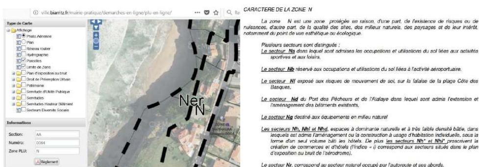
Figure 3. Cartographie PLU sur un secteur de Biarritz et règlement PLU zone N associé.