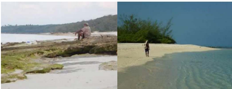
Figure 2. Hommes kanak scrutant l'océan depuis Cöu (photographie de gauche), depuis Gööny (photographie de droite) / Kanak man watching the ocean.