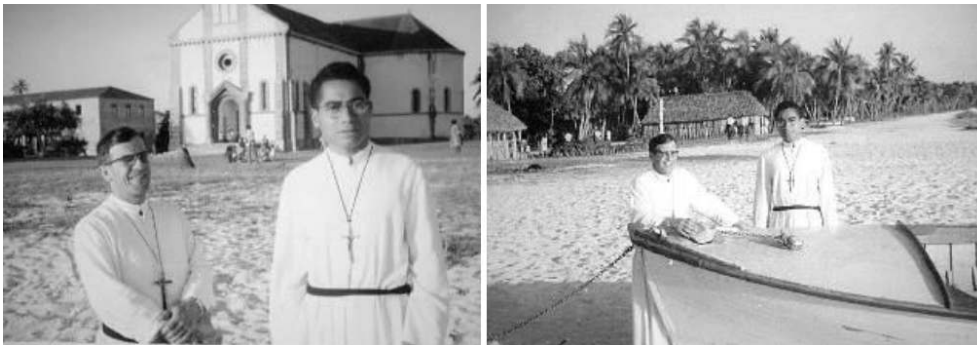
Figure 4. Photographies d'archive de la plage face à l'église de Saint-Joseph, Héo.