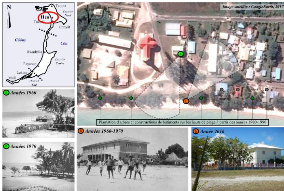
Figure 5. L'évolution paysagère d'un lieu témoin d'anciennes activités collectives à Saint-Joseph sur le littoral Gōōny / Landscape evolution of a place witness of old collective activities.