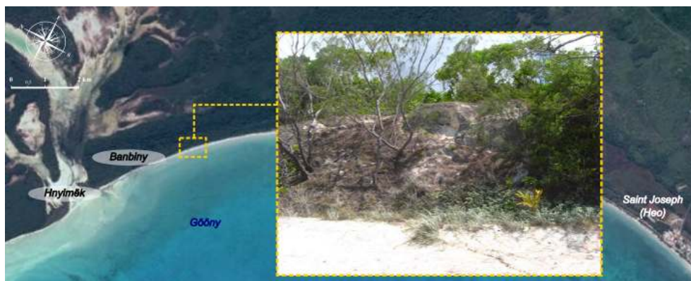
Figure 3. Paysage actuel de Banbiny.

« A Banbiny, le nom ça signifie les monticules de sables. Des dunes qui étaient aussi hautes que des maisons [...] » Homme de 68 ans, de la tribu de Takeji.