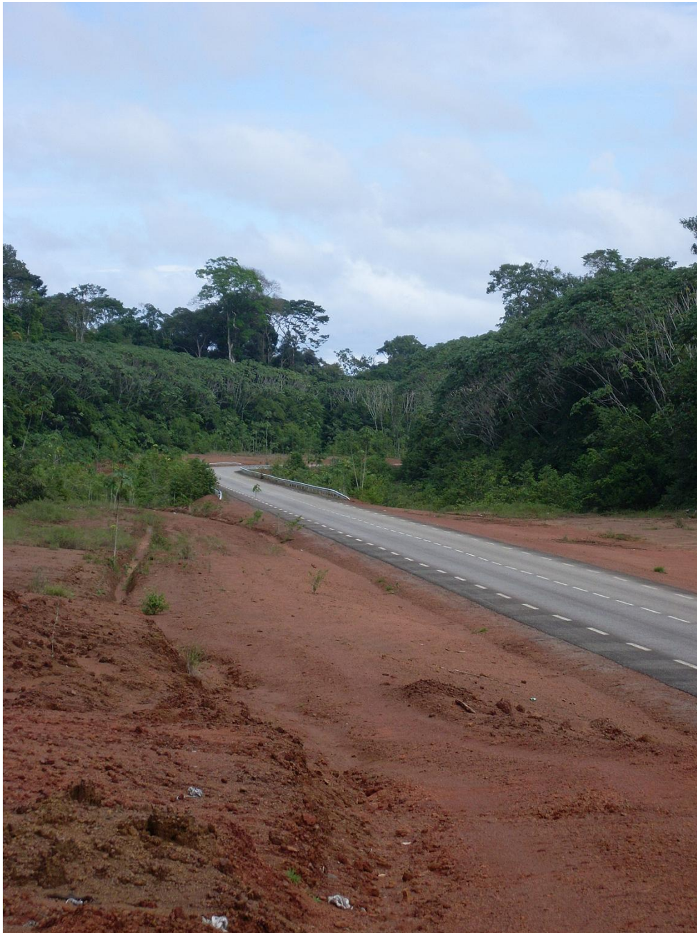
Figure 2. Portion de route entre Régina et Saint-Georges /Part of the road between Regina and Saint-Georges

Source : Photo M. B. d'Hautefeuille, janvier 2009