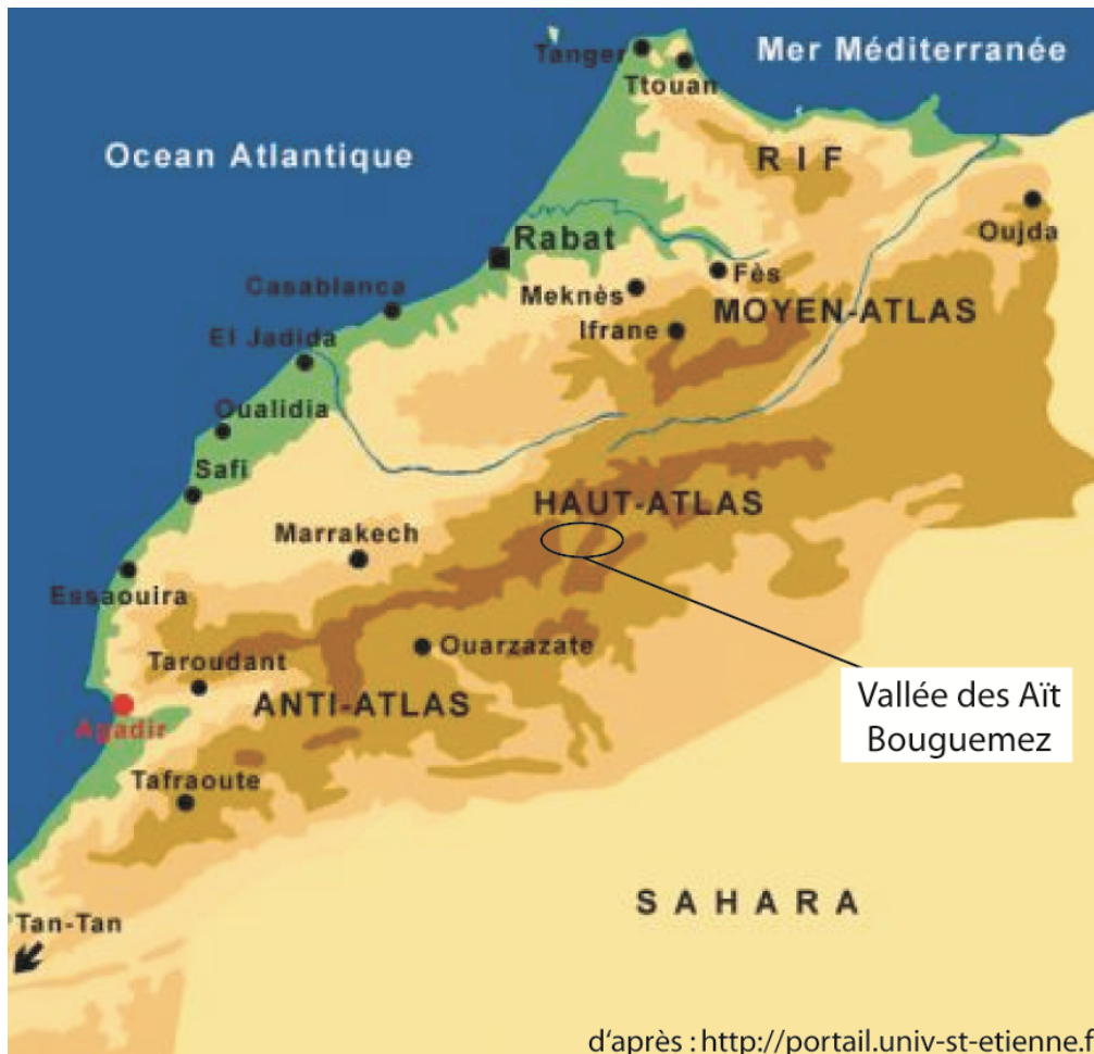
Figure 1. Carte de localisation du Haut-Atlas et des Aït Bou Guemez / Situation map from the high-atlas