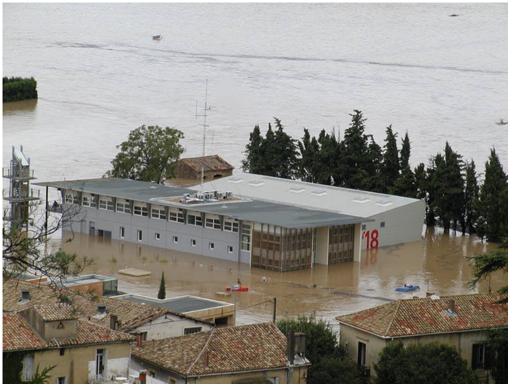
Figure 4. La caserne inondée / Firehouse flooded

37 Le taux de couverture des dédommagements par les experts de l'assurance est également intéressant à observer, in fine il est d'un tiers, le reste revenant à diverses formes de la solidarité sociale et publique (cf. citation ci-dessous).