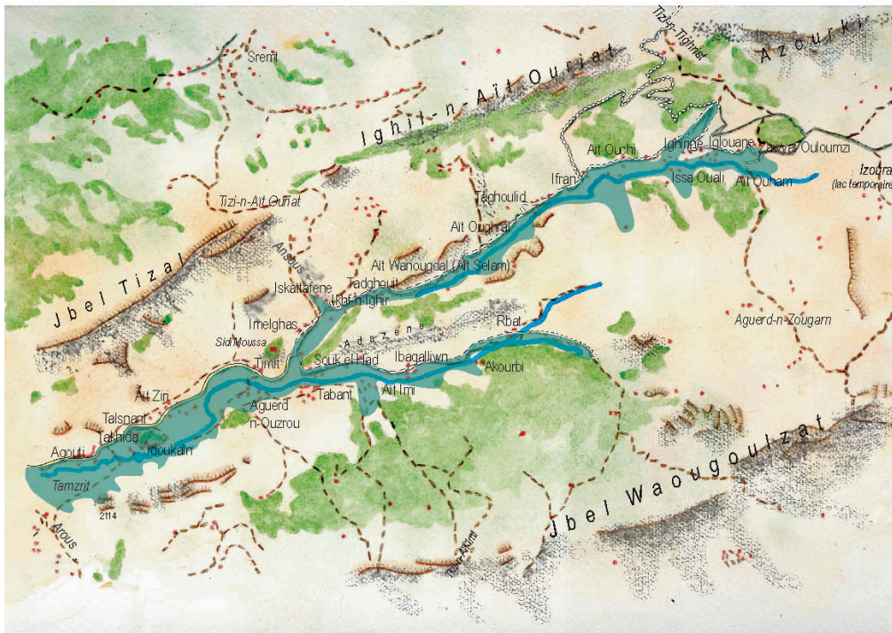
Figure 2. Carte schématique des Aït Bou Guemez () / Sketch-map of the Aït Bou Guemez valley (Liliane Dumont)