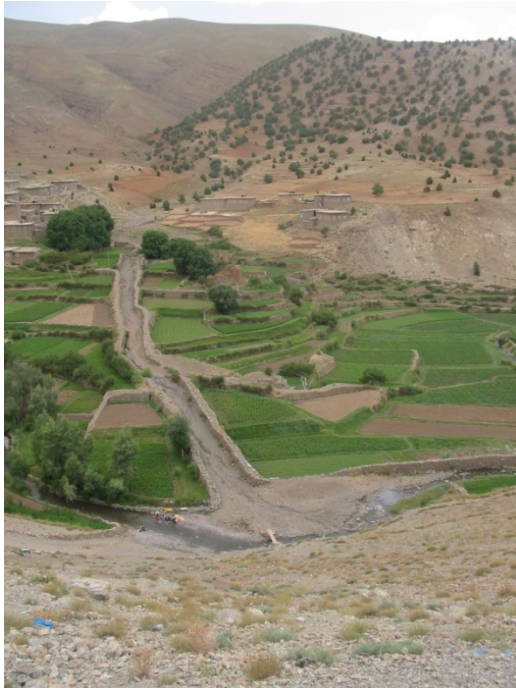
Figure 5. Le vieux village de Aït Aïssa ou Ali et son affluent latéral / The old village of Aït Aïssa ou Ali and its side brook