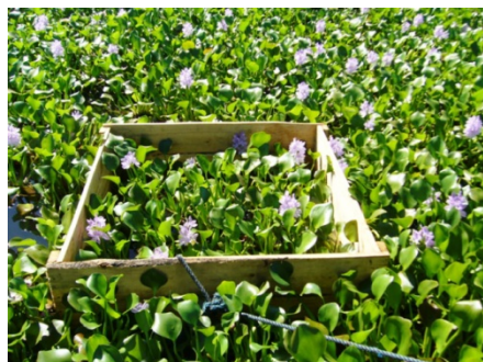
Figure 3. Méthode de placeau : quadrat de 1m 3