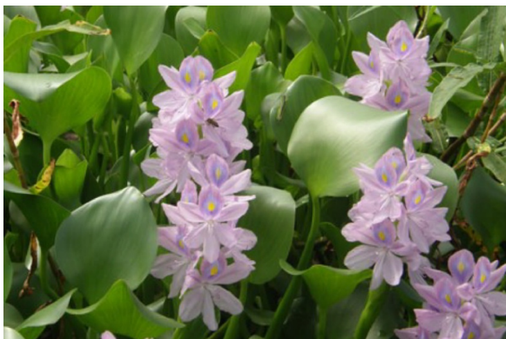
Figure 1 : La jacinthe d'eau « Eichhornia crassipes » (Pontederiaceae)