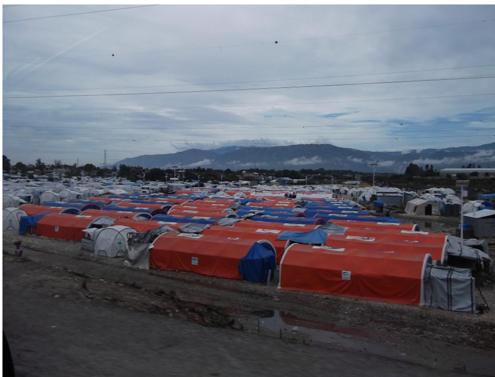
Figure 2. Un camp à la Croix des Bouquets

ou des organisations internationales (Carrefour, Croix des Bouquets) et présentent un plan au cordeau. Le quartier des familles sous les grandes tentes bleues se démarque de celui des ménages plus réduits qui occupent des tentes blanches de plus petite taille.