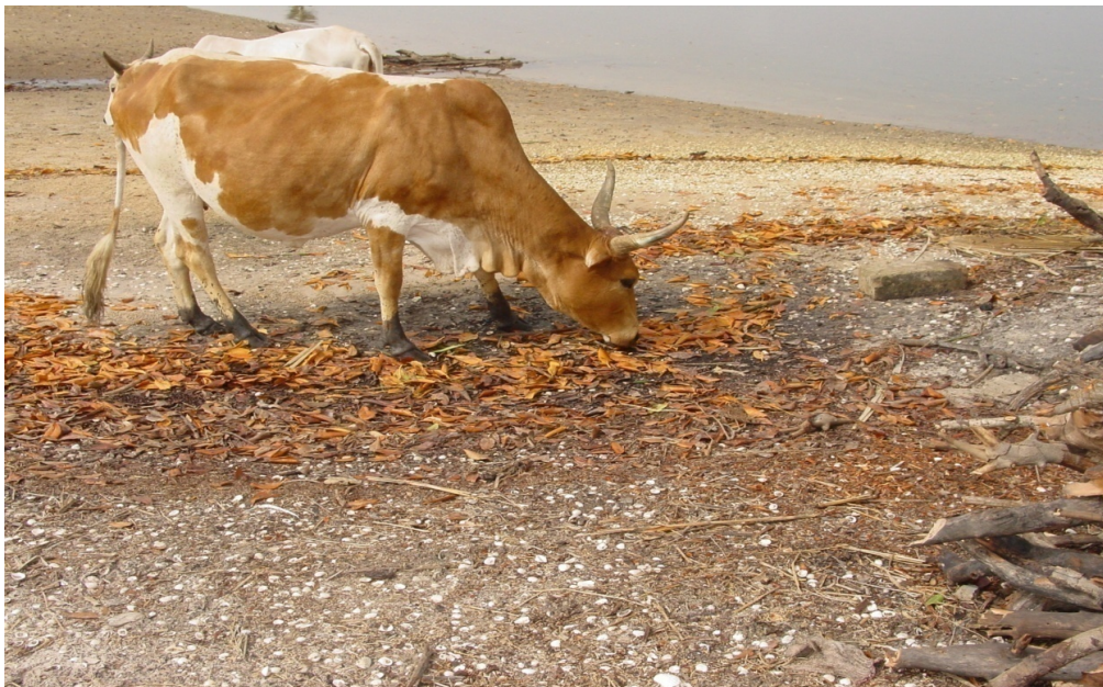
Figure 3. Vaches qui broutent des feuilles mortes de mangrove - Cows eating dead leaves of mangrove

5 Entre autres usages, les caprins broutent les feuilles et les propagules ayant chuté des palétuviers du genre Rhizophora sp. Les bovins quant eux descendent occasionnellement dans la mangrove pour brouter les feuilles et les diaspores de Rhizophora sp. et d' Avicennia germinans (Figure 3).