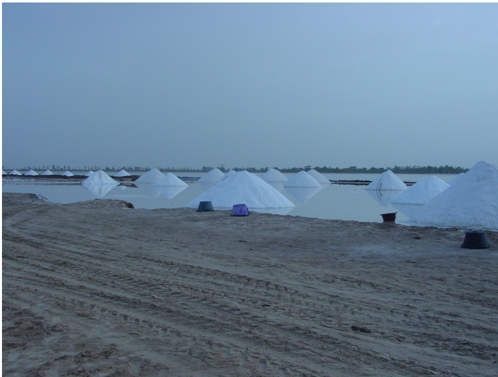
Figure 2. Exploitation semi-moderne des salines de Fatick - Semi-modern exploitation of salt in Fatick