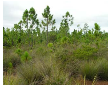
Figure 1. Invasion de Pinus caribaea sur des sols ultramafiques au sud de la Nouvelle-Calédonie.

L'effet direct de la température sur les invasions biologiques demeure controversé (Gabriel et al., 2001). Les modèles traditionnellement utilisés, basés sur les niches climatiques, font généralement apparaître des extensions des zones couvertes par les espèces invasives (Thuiller et al., 2007). De tels modèles présentent toutefois le défaut de faire abstraction d'autres facteurs de contrôle tels que la pression d'introduction, les conditions de milieu et les interactions avec communautés d'espèces en présence. Dukes et Mooney (1999) observent ainsi que le réchauffement climatique peut tout aussi bien conduire à une régression de l'aire occupée par certaines plantes invasives.