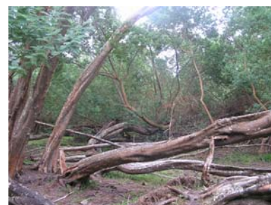
Figure 2. A l'île de Pâques, Acacia dealbata fut introduit pour la rapidité de sa croissance

contexte de fragilisation des habitats, des espèces indigènes d'intérêt patrimonial sont appelées à être transférées sur d'autres îles, à des fins de conservation (Richardson et al., 2009). En outre, les introductions porteront de manière privilégiée sur des espèces à croissance rapide (figure 2), dont on sait qu'il s'agit d'un trait de vie commun aux espèces invasives (Noble, 1989).