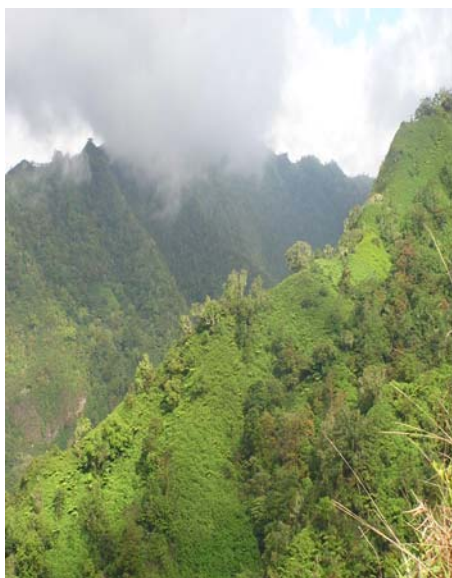
Figure 6. Zone dégradée envahie par des espèces ligneuses sur un relief montagneux escarpé en Polynésie Française

En revanche, les services culturels ne peuvent être qu'affectés dans une telle perspective de changement. La modification des paysages liée au bouleversement des formations végétales et au remplacement de certaines espèces indigènes ou exotiques par d'autres espèces exotiques peut être culturellement mal perçue. Ainsi en est-il de Dichrostachis cinerea , arbuste épineux très invasif sur la côte sous-le-vent de La Réunion, appelé à s'étendre en altitude avec l'élévation de la température, et qui supplante déjà les savanes herbacées. Celles-ci sont perçues comme l'une des composantes paysagères majeures des zones de basse altitude (CAUE, 1998).