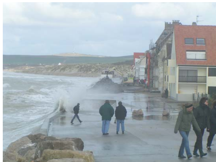
Figure 3. Submersion de la digue de Wissant le 21 mars 2007

La première alerte vraiment visible pour l'ensemble de la population, date du mois d'avril 2000, où la digue initiale, reposant sur des poches d'air, s'effondre. Les acteurs locaux semblent avoir pris conscience du problème. L'association locale « Les amis de Wissant » suit ainsi avec intérêt les travaux de réfection de la digue. Certains membres de l'équipe municipale participent par ailleurs activement aux réunions annuelles de l'EUCC-France ( European Union for Coastal Conservation ).