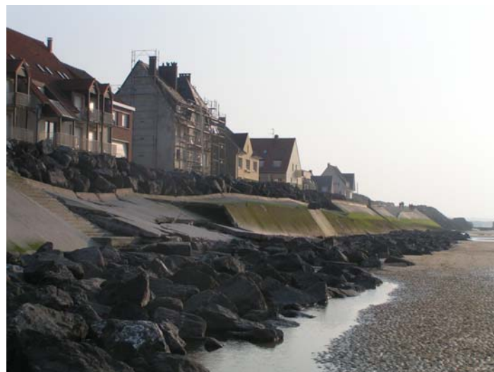
Figure 4.. Digue de Wissant éventrée, vue à marée basse