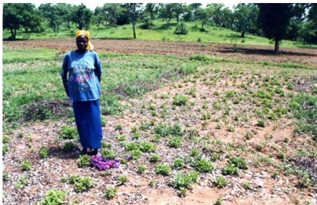
Figure 4. Les branches sont progressivement écartées.