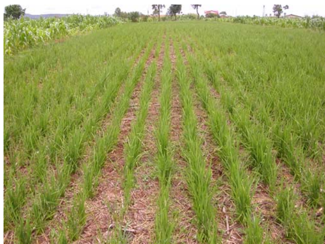
Figure 9. Riz pluvial en SCV sur couverture morte (Madagascar, Hautes Terres, site de référence TAFE)