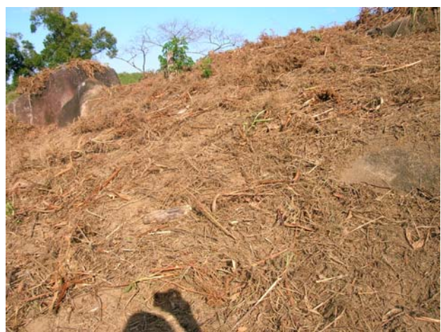
Figure 6. Paillis de résidus de défriche déposé sur un sol sarclé et planté de semences de gingembre (Madagascar, Tolongoïna). Les espèces vivaces sont entassées sur les pierres.

Certaines légumineuses (haricot niébé, pois de terre...) et cucurbitacées rampantes associées à une céréale pourraient être assimilées à une couverture vive mais celle-ci n'est pas permanente et la couverture reste très partielle.