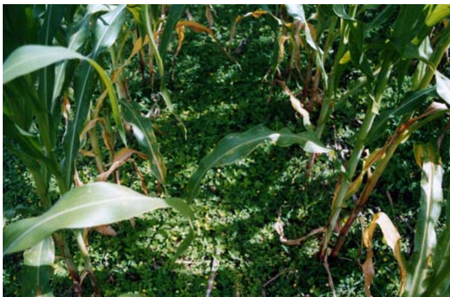
Figure 8. Maïs en SCV sur couverture vive ( Arachis pintoï ) : Ce système excluant le riz, n'a pas été adopté par les paysans malgaches (Madagascar, Hautes terres, site de référence TAFE)