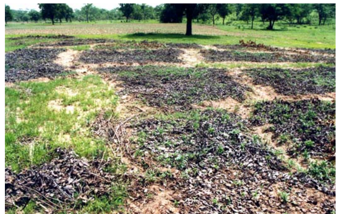
Figure 3. Les Coleus lèvent à travers le paillis.