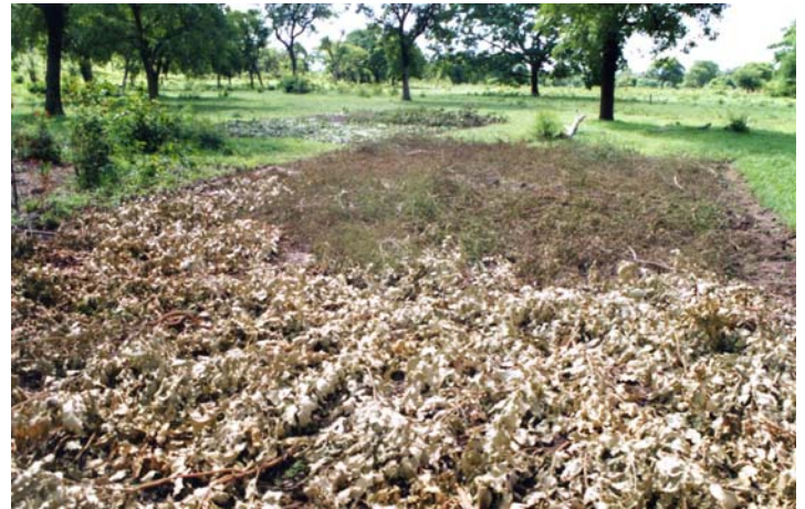
Figure 2. Paillis de branchages recouvrant un sol travaillé et planté de tubercules de Coleus (Burkina Faso, culture de femmes Mossi, région de Bondoukuy, origine : région de Bousse).

(moins de 10 acres), révélant l'importance du travail exigé. Il existe aussi le paillis de restauration de l'infiltration en Afrique soudano-sahélienne sur terrains dégradés (Figure 5) et le paillis à base de paille ou de branchages sur maraîchage, gingembre ou manioc à Madagascar (Figure 6) (Serpantié, 2008). Les objectifs sont donc précis : horticulture de tubercules sensibles à la chaleur, plantes cultivées couvrant mal des sols travaillés en pente et restauration locale de l'infiltration. Les éteules des céréales persistent souvent sur le sol pendant la saison sèche mais leur recouvrement s'affaiblit rapidement après le passage des troupeaux, des divers usagers, des termites et des feux de brousse.