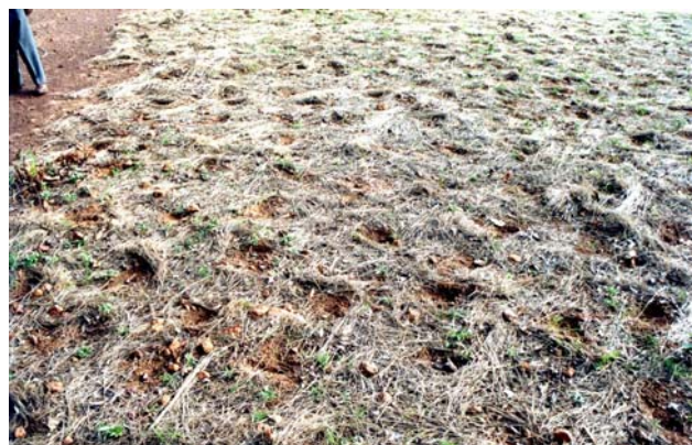
Figure 5. Paillis d'herbes fauchées pour restaurer l'infiltration d'une zone encroûtée. D'autres matériaux sont utilisés (tiges d'oseille de Guinée, branches de Piliostigma ....) (Burkina Faso, région de Kaya).