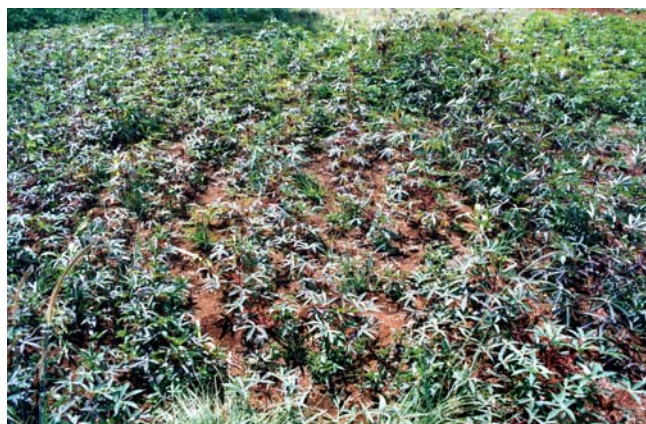
Figure 10. Jeune couvert de manioc associé à brachiaria repiqué (Madagascar, Hautes Terres, site de référence TAFE)