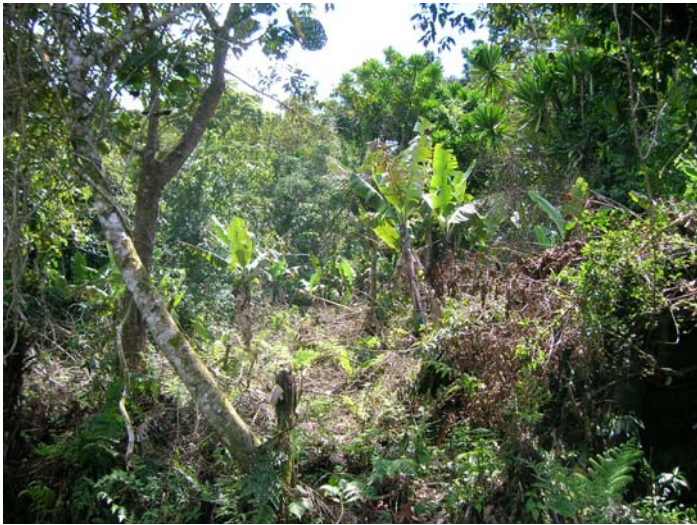
Figure 1. Défriche-paillis pour l'installation de bananiers à Madagascar, contournant les règlements de protection des forêts matures vis-à-vis du défrichement (lois anti-tavy).

Là où le feu est possible, l'AC représente donc une famille de systèmes de culture particulièrement inédite, voire révolutionnaire puisque ses promoteurs cherchent à rompre avec la pratique pluri-millénaire consistant à détruire la biomasse des terrains à cultiver et les préparer, soit par le feu, soit par l'enfouissement avec travail du sol. En revanche, des pratiques correspondant à chacune des règles de l'AC sont plus répandues.