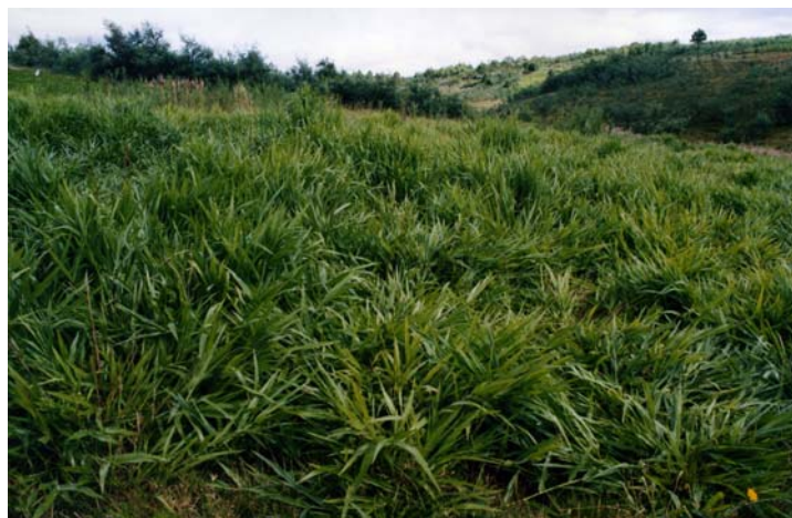
Figure 11. Couvert de brachiaria comme culture fourragère et jachère améliorée à reprendre en SCV après destruction par fauche et glyphosate (Madagascar, HT, site de référence TAFE), (Photo : Georges Serpantié)