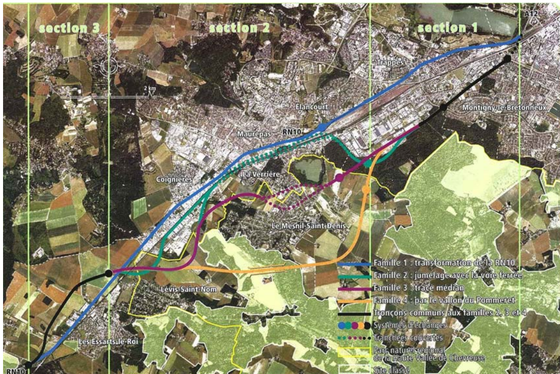
Figure 2. Les quatre familles de tracés du projet de prolongement de l'autoroute A12.