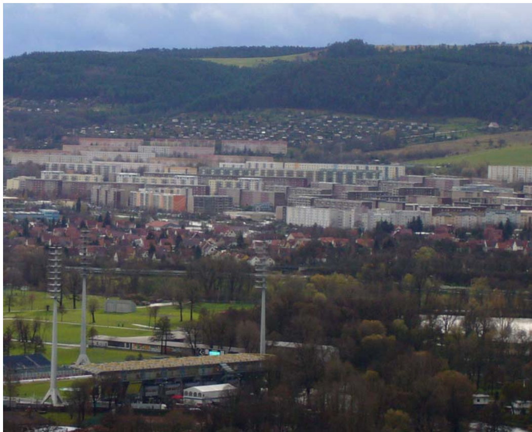
Figure 1. Un exemple de Plattenbausiedlung , Winzerla dans la ville de Iéna : la masse du quartier tranche dans le tissu urbain.

Ce déclin démographique et les difficultés du secteur économique ont conduit à la multiplication des logements et bâtiments inoccupés et des espaces en friche. En 2003, année où le nombre de logements vides a atteint son maximum, il était de 31 000 logements, soit 20% du stock (Fachbereich Stadtentwicklung und –planung, Netzwerk Stadtumbau, 2007b) Afin de gérer au mieux le devenir de ces espaces, et donc de l'ensemble de l'espace urbain, Halle a mis en place un schéma intégré de développement urbain. C'est une démarche rendue obligatoire par l'Etat fédéral dans le cadre du programme Stadtumbau Ost 4 , programme qui aide les villes des nouveaux Länder à faire face au défi du déclin 5 . Le schéma intégré de