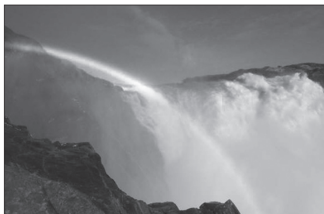
ILLUSTRATION 6 : Arc-en-ciel sur les chutes Nastapoka.

Il en va de même pour la place des animaux dans le paysage. Ils sont très peu montrés dans les photographies (3 sur 63) mais évoqués : « J'aime ce paysage parce qu'il y a beaucoup