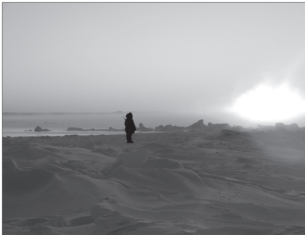
ILLUSTRATION 5 : Coucher de soleil sur la Baie d'Hudson et les îles face au village.

de l'ère géologique et de la permanence de l'identité inuite est immortalisée par la grandeur des structures paysagères, tandis que la seconde temporalité, celle du vécu quotidien dans un univers exigeant et changeant, est incarnée par les ambiances sur le vif et les effets de lumière éphémères comme les paysages de couchers de soleils, de brumes et brouillards, d'arcs-en-ciel.