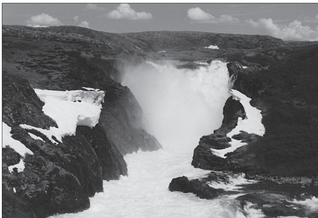
ILLUSTRATION 4 : La monumentalité des chutes Nastapoka.