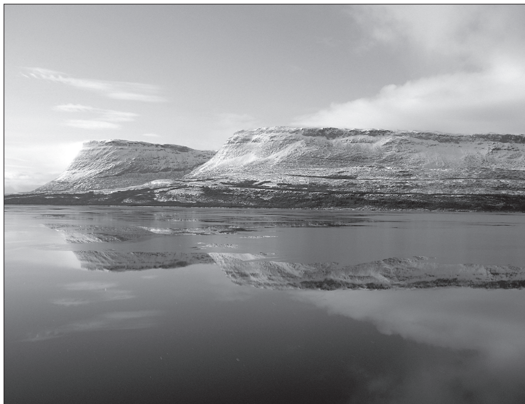
ILLUSTRATION 3 : Le goût prononcé pour la monumentalité des falaises du lac Guillaume-Delisle est une expression de la permanence et de la grandeur de la présence inuite sur ce territoire.

Ce mode d'analyse individuel des clichés est croisé avec un mode d'analyse global de l'ensemble du corpus, où les images sont également appréhendées les unes par rapport aux autres, et donc des thématiques s'en dégagent.