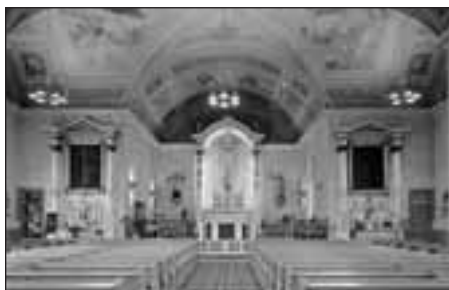
Carte postale : « Église de la Mission Saint-François-Xavier où l'on conserve les reliques de la Vénérable Kateri Tekakwitha, Caughnawaga, Québec. »

Le tourisme a évolué de la même façon, en exigeant une trace de plus en plus complète ; parti, tantôt des reliques, tantôt des ruines, ici d'ossements dérobés à la vue, là des pierres éparées de l'Acropole, il est aujourd'hui « urbain » ou s'émaille de parcs à thèmes. Ainsi, d'une part, assista-t-on à une dissociation des significations « patrimoniales » réservées à des groupes socioprofessionnels de plus en plus restreints : les historiens d'architecture pour le monument, les archéologues pour la ruine, les croyants pour l'église – en quelque sorte. D'autre part, l'univers du touriste se vit, progressivement mais décisivement, littéralement envahi par « l'interprétation » qui devait, dans cette perspective de « complètement », être superposée à l'objet.