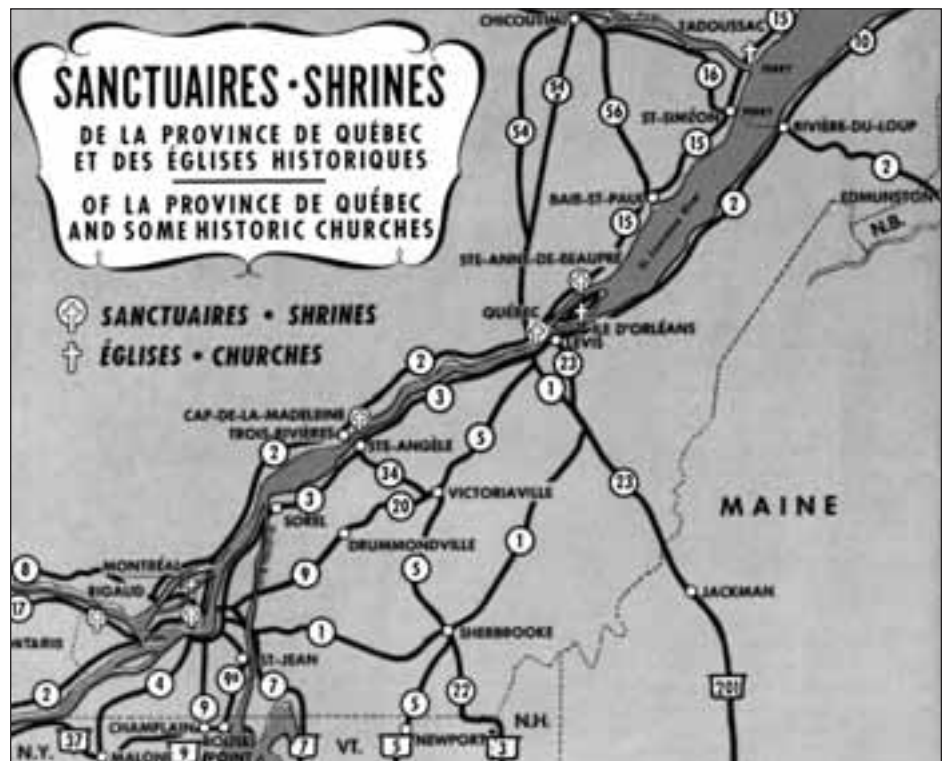
Sanctuaires – Shrines de la province de Québec et des églises historiques, illustration du guide La province de Québec Canada , 1950.

Cependant, force est de constater que les églises / monuments historiques gagnaient au maintien de la pratique religieuse, car, tant que celle-ci demeurait, elles ne requéraient guère d'autres formes de patrimonialisation – interventions de mise en valeur ou, comme on en parlerait plus tard, d'interprétation – que celle qui les investissait de sens au quotidien, par le biais des rituels du culte. C'était le cas, à tout le moins, pour les visiteurs qui possédaient le langage nécessaire à la reconnaissance du sens, en l'occurrence ce « catholicisme » invoqué par Barrès. Cette animation muséologique avant la lettre justifie d'ailleurs sans doute les divers avantages consentis au clergé, à tout le moins là où les églises, identifiées a priori ou a posteriori comme monuments historiques, ont, comme en France, été nationalisées. C'est elle, aussi, qui explique que la Commission des monuments historiques qu'on créa au Québec en 1922, sur le modèle de sa cousine française, ne se soit intéressée à d'autres formes d'édifices que lorsque ceux-ci étaient désuets, alors qu'elle accorda de tout temps une attention soutenue aux églises. Dès leurs premières réunions, les commissaires dis-