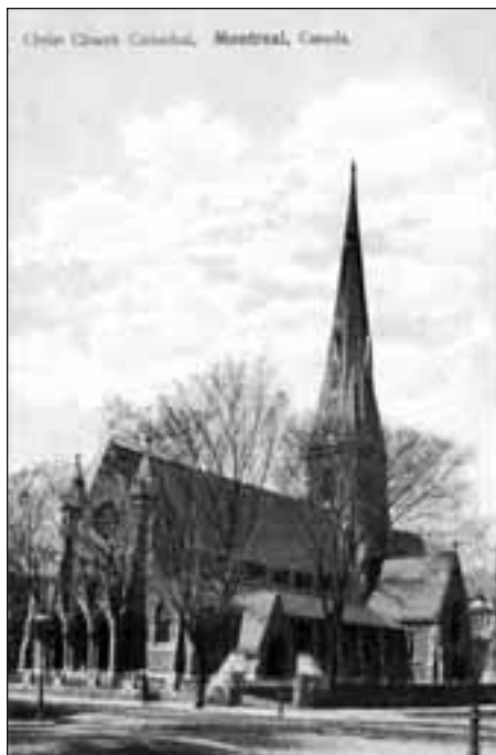
Le « beau gothique » de la Christ Church (Montréal), comme le voulait le guide La douce province , lui aussi représenté parmi les centaines de cartes postales des églises de « la ville aux clochers ».

tié du XX e siècle) qui, si protestant fut-il, pouvait néanmoins en mesurer l'investissement sémantique, elles étaient assorties à un imposant appareil discursif esthétique, par surcroît du religieux qui, du fait du culte actif, « allait de soi ». De Montréal, on lisait ainsi qu'elle « renferme près de 500 églises, chapelles et temples. La ville aux clochers ! C'est l'impression dominante qu'elle laisse aux touristes. [...] La véritable voix de Montréal, ce n'est pas la sirène d'usine, mais le carillon » (Chemin de fer national du Canada, 1923 : 14). Le même guide, publié en 1923, ne recensait d'ailleurs dans la métropole, au titre des « édifices et monuments », que des églises (et presque autant parmi les « sites historiques ») :