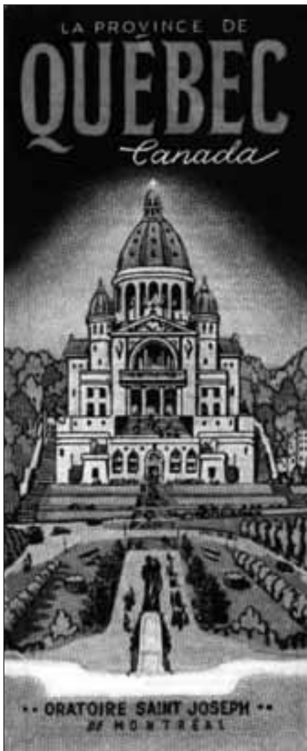
Oratoire Saint-Joseph, rabat de couverture de la carte La Province de Québec Canada , 1941.