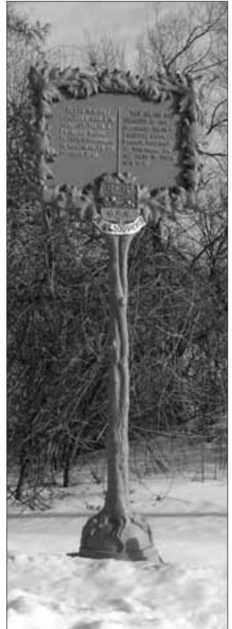
Plaque commémorative posée auprès de l'église de Sainte-Jeanne-de-Chantal de l'Île-Perrot 10 .

Dans les Albums des églises ou dans les brochures des congrès eucharistiques, ces premiers grands guides touristiques du Québec moderne, mais aussi dans tous les autres guides, les églises furent longtemps, de tous les possibles monuments, les plus fréquemment cités. D'autant que, pour animées qu'elles étaient aux yeux du visiteur étasunien (touriste de prédilection du Québec de la première moi-