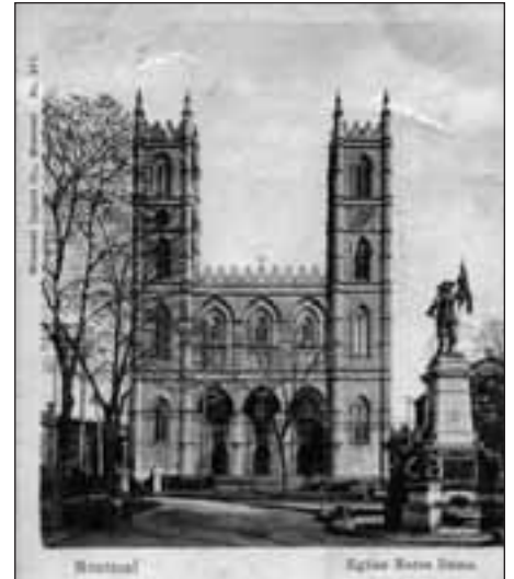
« L'architecture gothique perpendiculaire » de Notre-Dame de Montréal, selon l'interprétation de Gilbert Gérard. Carte postale.

On put d'autant plus croire à cette « accessibilité universelle » des monuments qu'ils furent bientôt abondamment interprétés, tantôt par une histoire de l'architecture alors florissante, tantôt par une sémiocratie qui se renouvela en inventant la « muséologie » comme discipline autarcique productrice de « savoirs » et de « sens » à appliquer, a posteriori , aux monuments qui méritaient son attention. Cette discipline, qui en effet trouva sa dénomination au début des années 1930 (alors même que naissait le tourisme de masse), codifia ainsi ses ambitions dans « l'ensemble des connaissances scientifiques, techniques et pratiques concernant [...] la présentation des collections [...], constitué en discipline autonome et faisant l'objet d'un enseignement 20 ». On était bien loin, dès lors, des a priori de l'odeur d'encens, du prêche de l'officiant, du carillon des cloches que tout un chacun comprenait ou, à la limite, qu'une forme d'élite était à même de savourer, du fait de la culture par laquelle elle tenait à se définir, cette culture apprise de sens communs en voie d'extinction, cultivée comme l'avaient été, aussi, les significations des ruines grecques, romaines ou égyptiennes pour le Tour-ist .