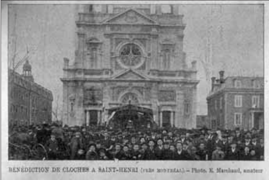
La bénédiction des cloches de Saint-Henri (Montréal), en 1895, attire la foule.