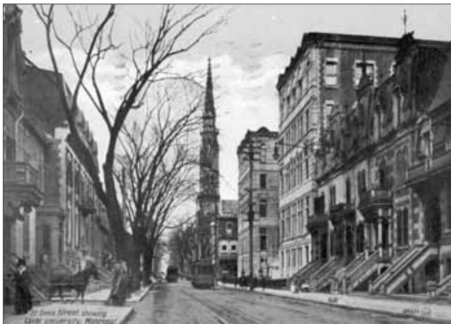
Carte postale représentant, en 1913, le « clocher le plus élevé de Montréal », comme le voulait l'interprétation des guides touristiques. Le clocher (précisément) et le transept sud de l'église Saint-Jacques ont été classés en 1973 par le gouvernement du Québec, alors qu'on démolissait l'église ; ils sont depuis intégrés au pavillon Judith-Jasmin de l'UQAM.

Arrive to Réveillon in time to say "Bonne nuit" to "les petits enfants." Nibble on hors d'œuvres until it's time for midnight Mass. After services, head home where "mémère" has woken the toddlers again—it is time to open "les étrennes." The feast follows [...]. The Québécois have another Réveillon, which they'll inform you with a grin, is less "formal" than Christmas. Which means you can skip Mass [...] and go straight to the feasting and dancing. (Tourisme Québec, 1978 : 72)