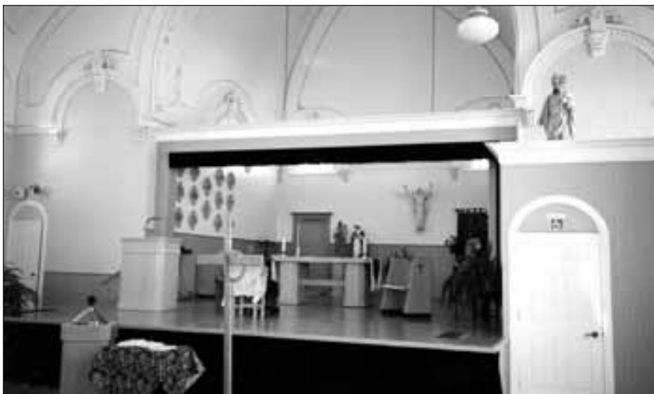
Église Saint-Philéas, Lotbinière.

Appuyant les activités autres que le culte dans des églises, d'autres « ponts » seraient à jeter entre la poétique de l'espace que l'on y expérimente et le principe de réalité. Le philosophe allemand Martin Heidegger (1889-1976) prenait l'exemple du « pont » jeté entre deux rives pour définir un « lieu » et lui conférer toute sa densité 4 . À la lumière de ses travaux, nous pressentons qu'une riche poétique de l'espace devrait permettre de se référer à la métaphore du « pont », c'est-à-dire de pouvoir profiter d'avancées concrètes solidement arrimées