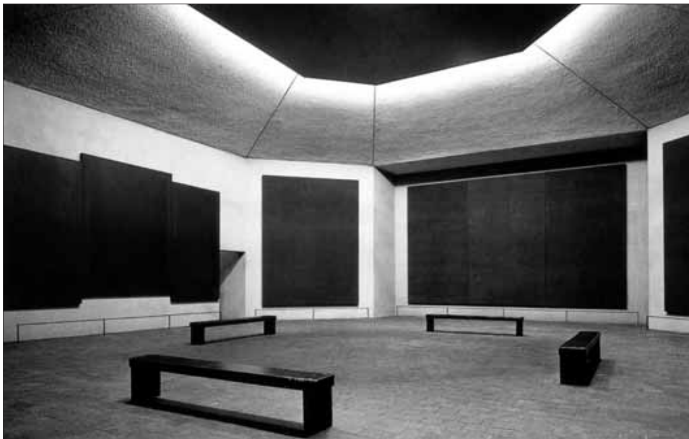
Intérieur de la Chapelle Rothko, Houston, Texas, 1971 13 .

Heureusement qu'il y a déjà des jalons posés dans les tâtonnements actuels, en recherche de l'équilibre entre la tête et le cœur. À cet égard, le cas de la chapelle Rothko, à Houston, est probant. Même s'il ne s'agit pas d'une « reprise » d'église au sens d'un bâtiment patrimonial à revitaliser, l'exemple mérite d'être étayé.