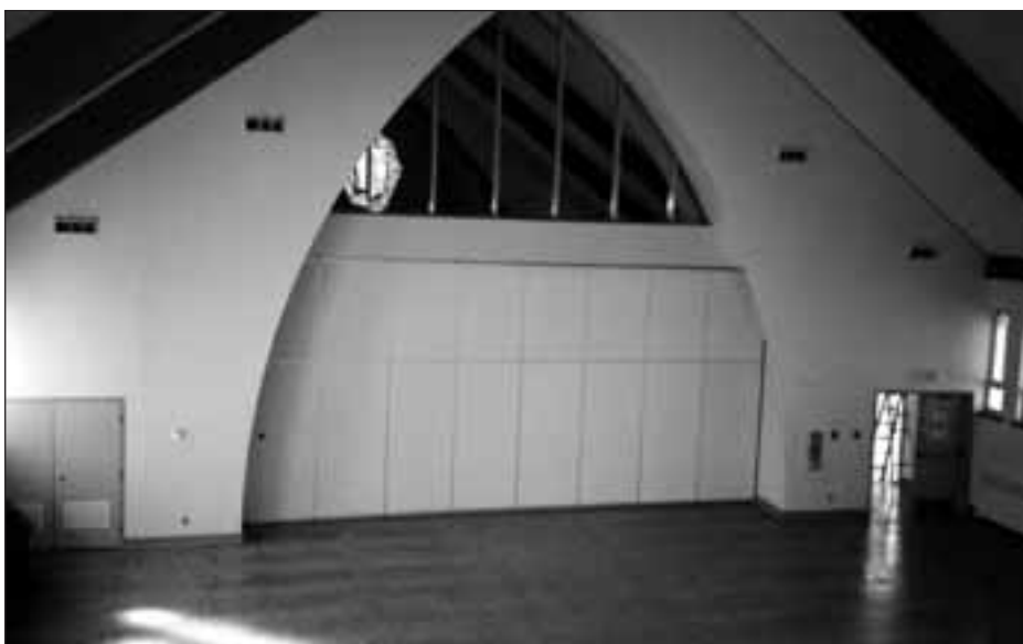
Église Notre-Dame-de-la-Garde, Longueuil.