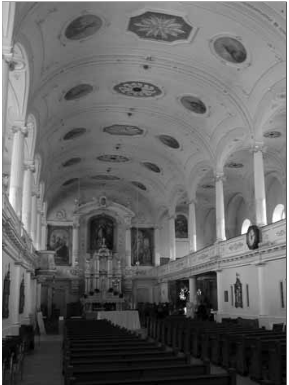
La nef « recyclée » de l'Église Notre-Dame-de-Jacques-Cartier, Québec, 2003 1 .

Le philosophe français Gaston Bachelard (1884-1962) avait reconnu l'importance des sentiments qui surgissent d'une expérience semblable. Il a même tenté de les systématiser quelque peu dans son livre La poésie de l'espace (1957). Indépendamment de sa contribution savante, un grand nombre de défenseurs du patrimoine ont recouru au genre de la « poésie de l'espace » afin de favoriser la sauvegarde des belles églises par leurs concitoyens, en s'efforçant de les sensibiliser au patrimoine. L'approche demeure encore d'actualité si l'on se fie à de récentes parutions, films documentaires, etc.