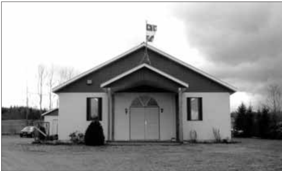
Le centre communautaire de Saint-Jacques-le-Majeur, près de Disraeli, construit sur le site de l'ancienne église du village, qui a été incendiée en 1993 7 .

De fait, trop d'idéalisme tue. Maintenant à la mode, la fin des utopies ou tout simplement le bémol conféré aux idéaux collectifs n'est pas si malsain que cela. Dans le domaine de l'architecture religieuse, cela a engendré la construction d'églises plus modestes, généralement assez respectueuses de la réalité des communautés qu'elles desservent. « Le temple est rempli par ce qui se trouve au-dessous », écrivait Hugues de Saint-Victor (1962 : 101).