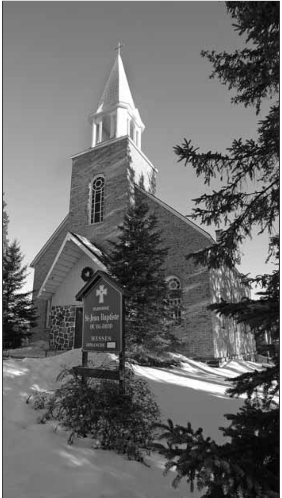
Église de Val-David, Laurentides 10 .

Enfin, il est heureux que la notion de projet puisse nous écarter un peu d'une vision aussi englobante de la vie en société que le christianisme. Cette précaution, la notion de « patrimoine religieux » ne la prendrait pas assez semble-t-il. Et cette précaution est non seulement nécessaire, mais fondamentale ! En 1968, le jésuite Joseph Comblin constatait judicieusement que « par un concours de circonstances il y eut coïncidence entre le sens de la vie communautaire et le christianisme » (1968 : 395). Son assertion qui visait le Moyen Âge vaudrait également pour le Québec d'avant sa pleine entrée dans la modernité. Maintenant, de nouveaux projets donnent de l'expansion à la « coïncidence » repérée par Comblin, par la compatibilité des fonctions qui s'ajoutent au culte dans les églises ou y succèdent. De même, une philosophie de l'histoire comme celle de l'historien des religions Ernst Troeltsch abonde dans le même sens, en