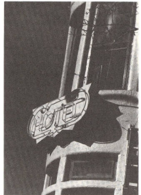
Des réservations en un clin d'oeil

Évidemment, on espère avec ce système augmenter la demande touristique (hausse du nombre de visiteurs au Québec, meilleure rétention au Québec des québécois prenant habituellement leurs vacances à l'extérieur et enfin prolongation des visites des touristes déjà sur place) mais aussi assurer une meilleure distribution régionale