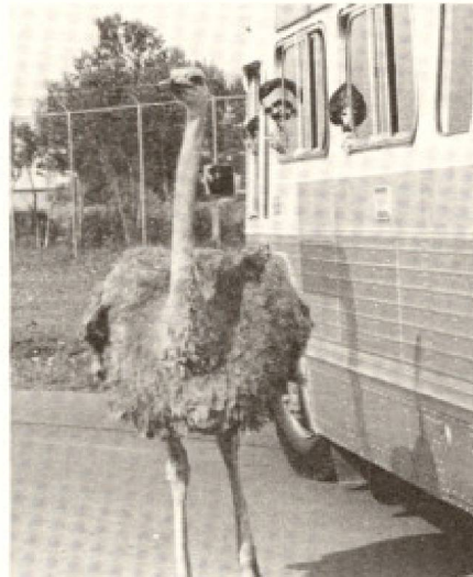
Le parc d'amusement peut constituer une attraction touristique majeure.