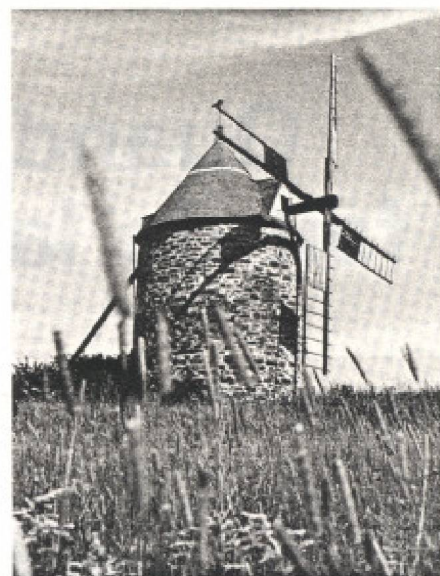
La région de Charlevoix est une zone à fort potentiel touristique. L'île aux Coudres est l'un des joyaux de cette région... avec quelques beaux moulins à vent.

Dans le domaine du tourisme, compte tenu de la grande flexibilité de la demande et de la rigidité de l'offre, il faut dorénavant fournir un produit versatile et adaptable aux fluctuations. La fabrication de produits bien déterminés, variés et localisés permet justement d'affronter certains aléas. Je songe, en l'occurrence, à une rencontre de travail avec les responsables de stations du Tyrol en 1983. L'hiver tyrolien, comme le nôtre,