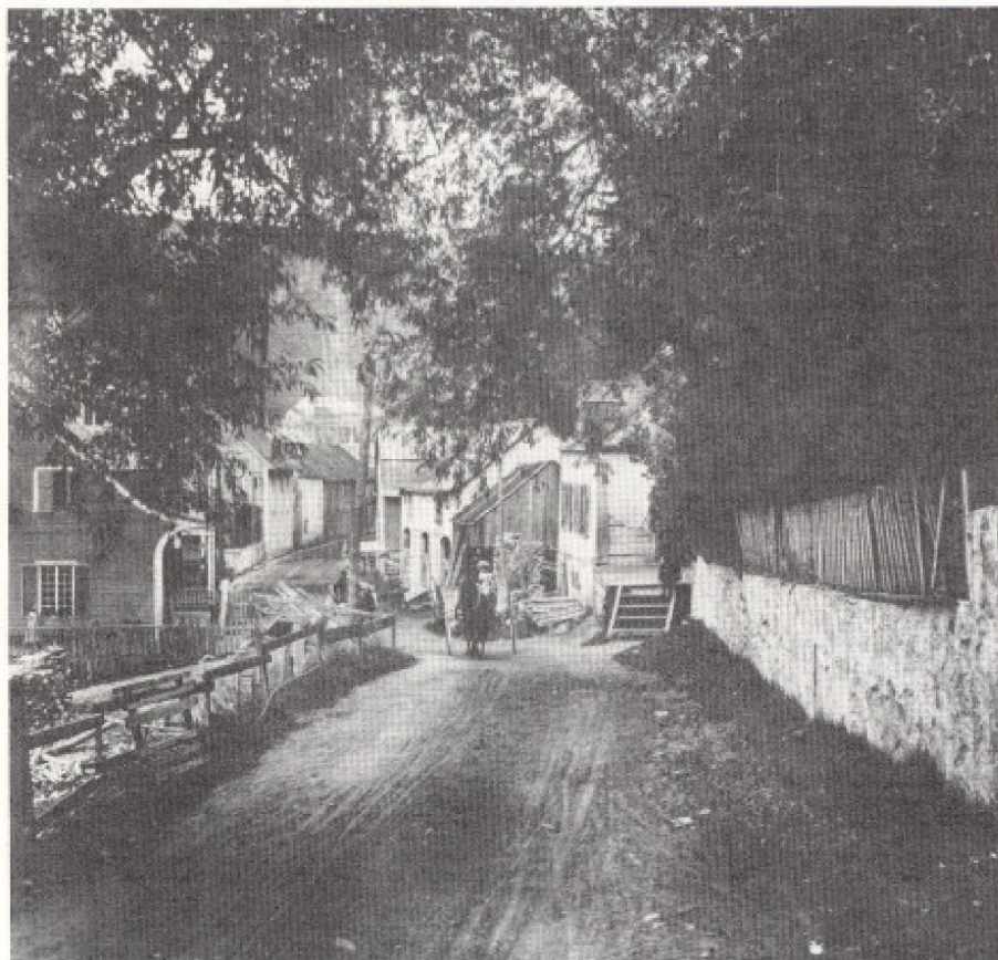
«Les modestes maisons et leurs portes hospitalières, les odeurs des feux de bûches et le son des cloches...»