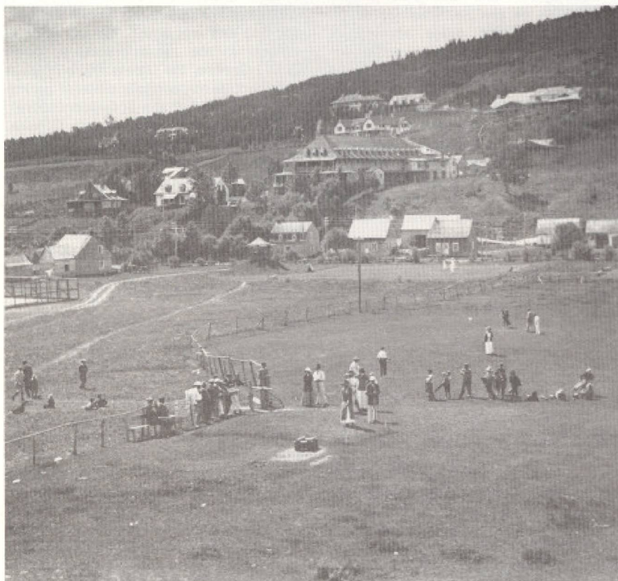
Dès la fin du XIX e siècle, la Malbaie (autrefois Murray Bay) était devenue la station la plus célèbre du Québec.

Dans les années qui suivirent la Cession, une nouvelle clientèle touristique fit son apparition: celle des voyageurs américains, britanniques ou canadiens du Haut-Canada.(...) Ces visiteurs étrangers, premiers touristes itinérants dans la vallée du Saint-Laurent, ne limitaient pas leur tour à la visite des deux principales villes mais suivaient généralement un itinéraire qui les conduisait, surtout après 1809, grâce aux bateaux à vapeur jusqu'aux chutes Montmorency d'une part, ou aux chutes Niagara d'autre part.(...) Le premier séjour d'été auquel se donnèrent rendez-vous les familles canadiennes-françaises jouissant de quelque fortune, fut Kamouraska. Ce village est le seul rendez-vous estival dont nous ayons trouvé mention avant l'âge des bateaux à vapeur.(...) En 1816, on ne mettait plus que vingt-quatre heures pour descendre le fleuve de Montréal à Québec et une quarantaine d'heures pour le remonter. Aussi les visiteurs, américains surtout, ne tardèrent-ils pas à se prévaloir en grand nombre de cette agréable croisière d'été. Voyageurs par tradition et jouissant déjà, pour plusieurs, d'une aisance qui leur laissait des loisirs, ils venaient par la rivière Hudson et le Richelieu, jusqu'à Saint-Jean d'où ils gagnaient ensuite Laprairie en voiture. Après avoir