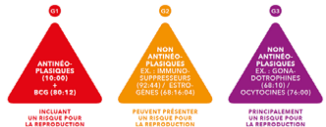
Figure 1. Classification des médicaments dangereux