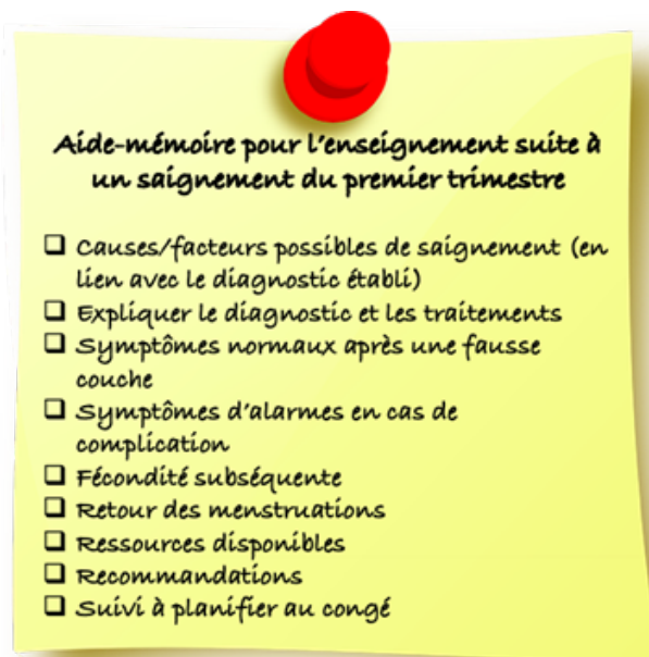
Figure 2. Aide-mémoire pour l'enseignement suite à un saignement du premier trimestre.

Il est aussi possible d'offrir des ressources de soutien psychologique en cas de non-viabilité de la grossesse. Voici quelques ressources disponibles: