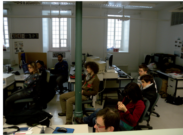
Figure 1. À gauche, les étudiants de l'École nationale supérieure d'architecture à Toulouse, et à droite, les étudiants de l'École d'architecture de l'Université Laval à Québec

Proposer une pédagogie collaborative dans un cours d'architecture virtuelle est assez rare et utiliser un environnement immersif rend cette pratique complexe et innovatrice. Depuis 2007, le professeur Pierre Côté donne l'atelier de design informatisé à l'École d'architecture de l'Université Laval. Cet atelier utilise une approche collaborative et Second Life. Il a la particularité d'être composé d'un groupe en salle à Québec et d'un deuxième groupe à distance à Toulouse, en France. Les étudiants doivent travailler, idéalement, en dyades composées d'un étudiant québécois et d'un étudiant toulousain. Afin de renforcer l'esprit de communauté d'apprentissage, il est convenu que chaque équipe travaille à une proposition commune qui recevra une évaluation pour le travail d'équipe, mais aussi une évaluation individuelle de la part de son responsable (professeur) toulousain ou québécois.