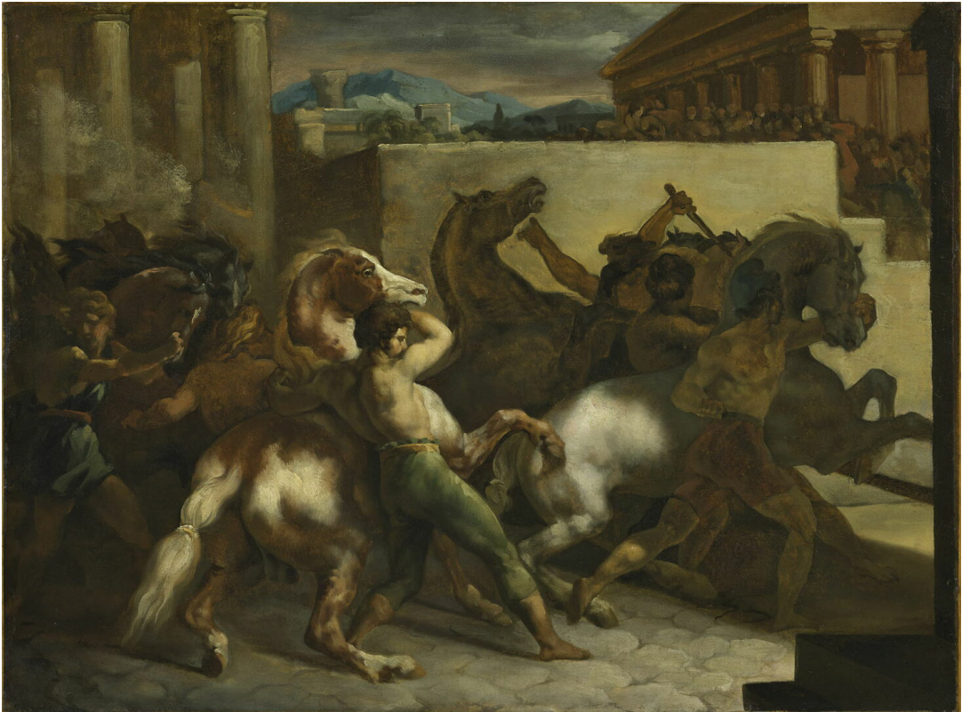
Figure 3. Théodore Géricault, Course de chevaux libres à Rome , 1 er quart du XIX e siècle (1800–1825), huile sur papier collé sur toile, 45 × 60 cm, Paris, Louvre.