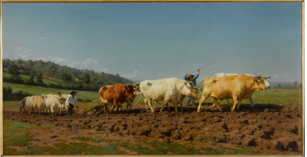
Figure 8. Rosa Bonheur, Labourage nivernais , 1849, huile sur toile, 133 × 260 cm, Paris, Musée d'Orsay.