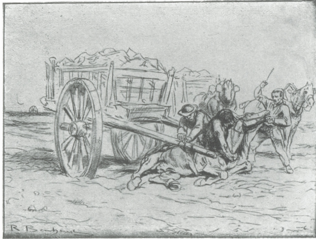
Figure 2. Rosa Bonheur, Les tombereaux de pierres , reproduction tirée de Rosa Bonheur, sa vie, son œuvre , par Anna Klumpke, p. 180.