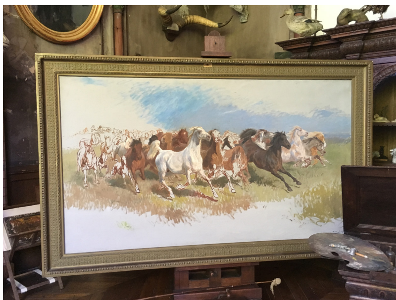
Figure 11. Rosa Bonheur, Course de chevaux sauvages , 1899, 126 × 221 cm, Bordeaux, Musée Rosa Bonheur.