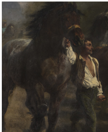
Figure 12. Rosa Bonheur, Marché aux chevaux , détail, 1853–1855, huile sur toile, 244,5 x 506,7 cm, New York, Metropolitan Museum of Art.

Bien que composée sur le même plan que les autres figures du tableau, la relation entre l'homme et le rouan est en substance si radicalement différente de celle qui caractérise les autres interactions interspécies sur la toile que, comme un collage, le couple semble avoir été transposé d'ailleurs, découpé d'un contexte différent puis ajouté à la scène. Ils sont psychologiquement détachés des relations dysfonctionnelles qui les entourent. Ils