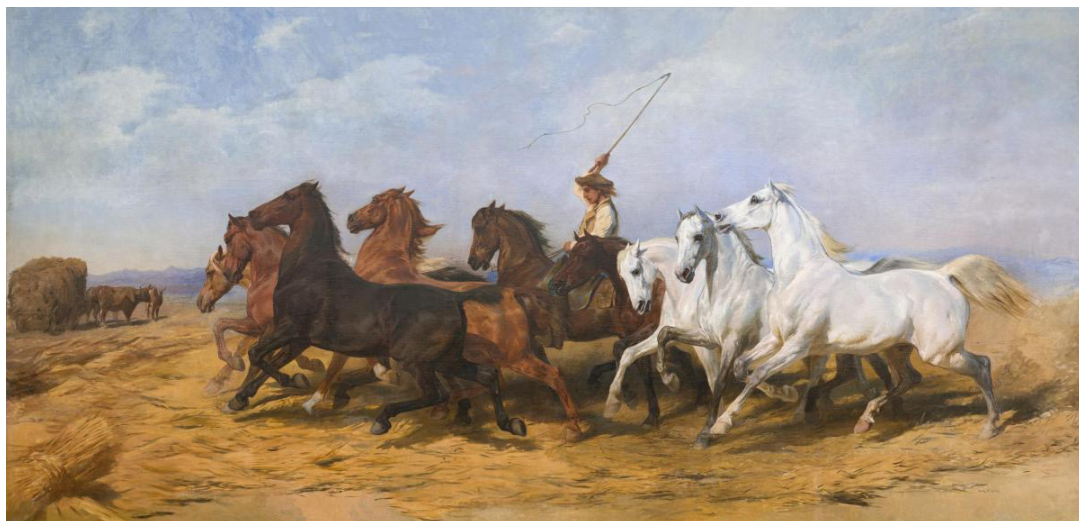
Figure 10. Rosa Bonheur, La Foulaison du blé en Camargue , 1864–1899, huile sur toile, 313 × 651 cm, Bordeaux, Musée des Beaux-Arts de Bordeaux.