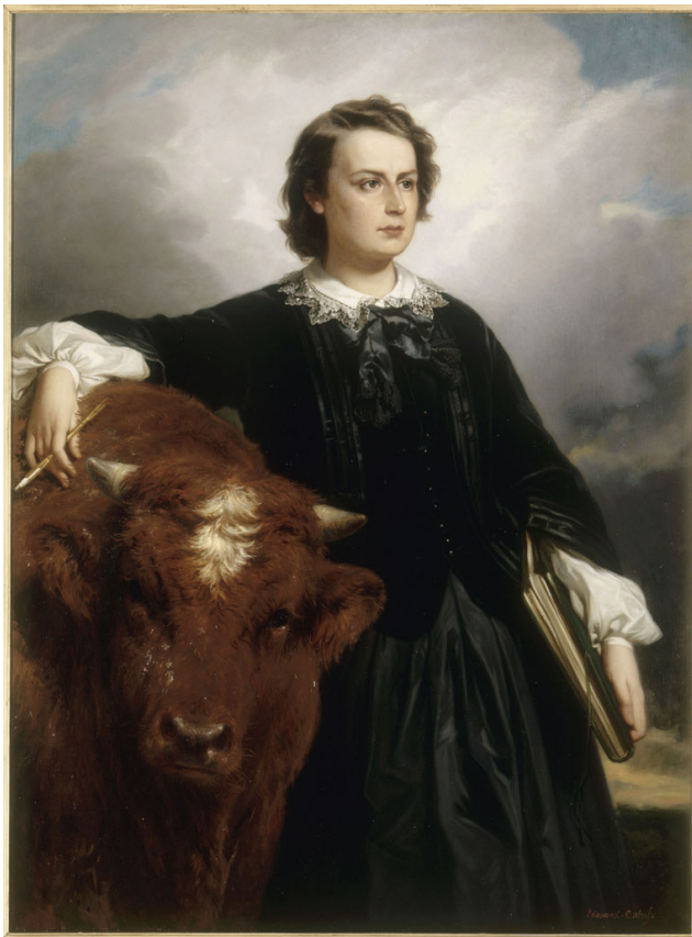
Figure 9. Edouard Dubufe et Rosa Bonheur, Portrait de Rosa Bonheur , 1857, huile sur toile, 130,5 × 97 cm, Musée national des châteaux de Versailles et de Trianon.