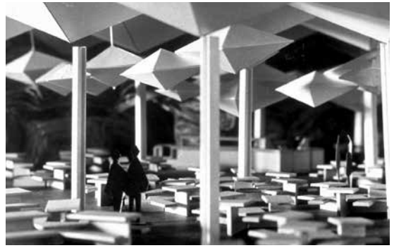
Figure 7. Photo de la maquette de la cafétéria du Pavillon du Canada à l'Expo 67, aménagement de Julien Hébert.

en 1962 et la Caisse de dépôt et placement en 1965. Ce sont ces institutions qui vont permettre le développement et l'esprit d'entrepreneuriat dans les années 1970. Malgré ce contexte, le manque d'intérêt pour la promotion du design exprimé par le gouvernement Lesage dans les années 1960 ne fait que contribuer à retarder l'évolution du Québec en ce qui a trait à l'émergence du domaine du design au sein de l'industrie de transformation secondaire.