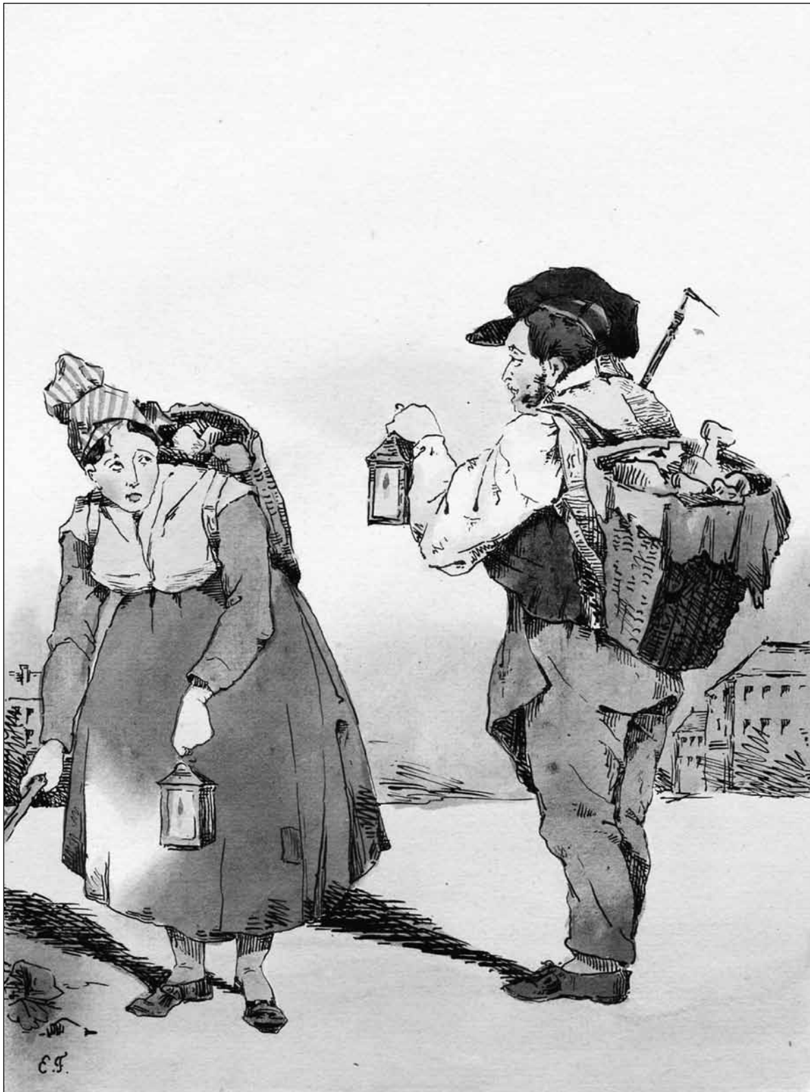
Figure 4. Eugène Forest, Souvenirs d'un flâneur de Paris : Rue Mouffetard, vers 1830 , lithographie colorée à la main, 15 x 11 cm, Londres, British Museum (Photo : © Trustees of the British Museum).