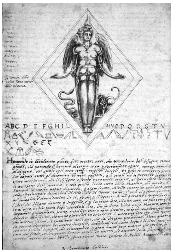
Figure 4. Benvenuto Cellini, Artémis d'Éphèse , projet pour le sceau de l'Accademia del Disegno, vers 1563, encre et aquarelle sur papier, 33 x 21,8 cm, Londres, British Museum.

Qui plus est, le texte fait de cette déesse nourricière la principale « ministra » de Dieu. Le mot « ministre » renvoie au rôle que peuvent jouer les sept planètes, dont font partie, dans la