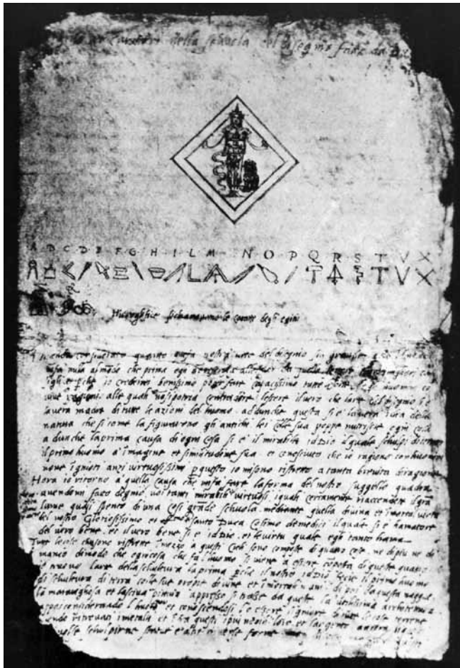
Figure 2. Benvenuto Cellini, Artémis d'Éphèse, projet pour le sceau de l'Accademia del Disegno, vers 1563, encre et aquarelle sur papier, 33,2 x 22 cm, Florence.

moment de la fonte du Persée aux côtés de ses ouvriers, en train de les aider et de les conduire tel un général en plein cœur de la bataille 30 .