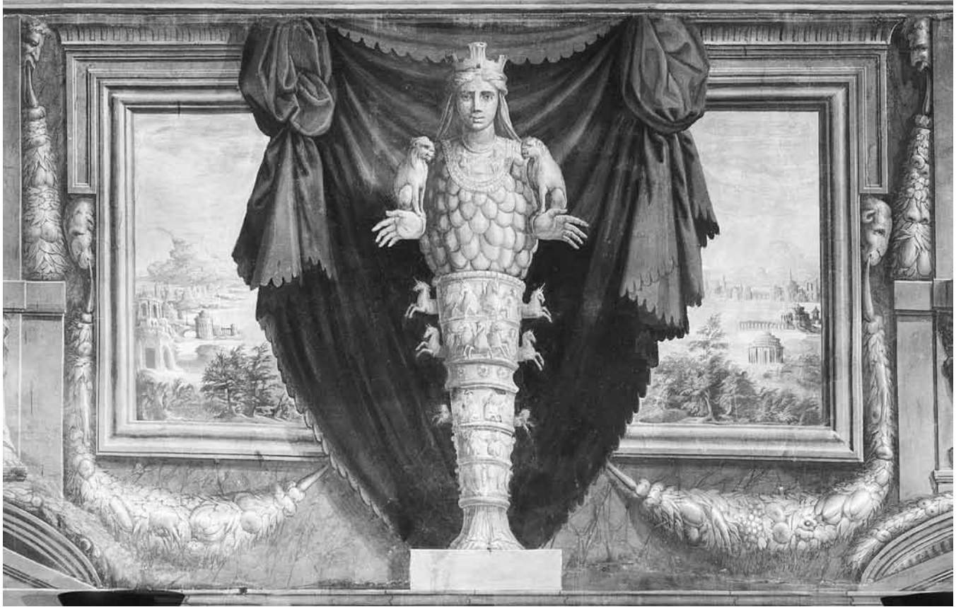
Figure 1. Giorgio Vasari, allégorie de la nature et de la peinture ( Artémis d'Ephèse ), 1548, fresque, Casa Vasari, Arezzo, Italie.

Vasari et Varchi, il emploie le terme d'« arti del disegno », ou arts du design , pour désigner tous les arts plastiques simultanément, emploi qui justifie l'existence d'une Accademia del disegno regroupant tous les arts sous son égide. Cependant l'expression plus moderne d'« arts plastiques » aurait été plus apte à véhiculer les partis pris de Cellini, car pour le sculpteur le problème de ce regroupement résulte de l'ambiguïté du mot disegno , qui peut trop facilement laisser croire que la pratique du dessin, qui est proche de la peinture, est plus importante que celle des autres arts. Cellini est catégorique sur ce point : l'art fondamental est la sculpture, et pour être bon peintre il faut d'abord être bon sculpteur. C'est uniquement parce que Michel-Ange savait sculpter qu'il a pu devenir un peintre de talent 27 .