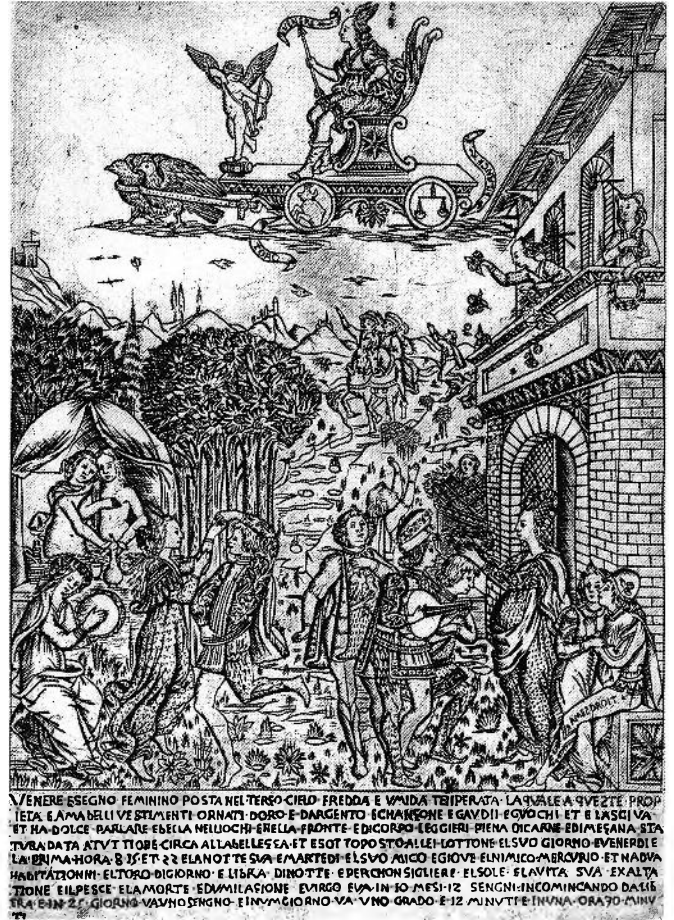
Figure 1. Atelier de Baccio Baldini ?, Vénus et ses Enfants , gravure florentine sur cuivre, 1464-65, Londres, British Museum.

forcément plus beau, plus musicien et plus séduisant, c'est-à-dire plus vénusien. Dame Porzia remarque la beauté corporelle du jeune artiste dans un discours qui fait écho au Courtisan de Castiglione : pour elle l'apparence physique du jeune homme témoigne de sa haute vertu, et un peu plus tard elle voudrait pouvoir le récompenser d'un château 17 . Le décor de leurs entretiens est la Farnésine, et, lorsque la dame le remarque pour la première fois, il est en train de dessiner la figure de Jupiter, tirée de fresques de Raphaël représentant les amours des dieux. Pour lui montrer de quelle façon il compte refaire son bijou, il exécute un dessin rapide, qui fait dire à Porzia qu'il dessine trop bien pour un orfèvre 18 . C'est la seule scène des 520 folios de la Vita dans laquelle Cellini se met en scène comme copiste de Raphaël. Et malgré l'accent mis ici sur le dessin, le jeune et galant Benvenuto n'en fabrique pas moins pour elle un petit modèle en cire avant de commencer son ouvrage.