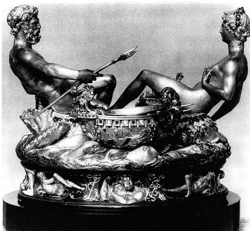
Figure 2. Benvenuto Cellini, Salière de François I er, 1539-43, or et émail, Vienne, Kunsthistorisches Museum.

de prison de Cellini et dont le récit sert de déclaration d'indépendance de l'artiste en ce qui concerne ses conceptions iconographiques. Deux humanistes, en présence du cardinal de Ferrare, s'affrontent en opposant leurs descriptions de l'œuvre à accomplir avant de s'en remettre au jugement de l'artiste. L'un est la grâce et la beauté personnifiées, l'autre n'est que laideur et difformité. Leurs discours reflètent leurs traits, mais ni l'un ni l'autre ne produit pour Cellini une description qui mérite traduction en termes plastiques. Quand on lui demande de choisir entre leurs « esquisses en paroles », entre d'un côté Vénus avec Cupidon, et de l'autre l'épouse de Neptune entourée de Tritons, hommes-poissons, Cellini déclare qu'il leur préfère un de ses « propres fils », comme celui qu'il va leur montrer, fruit de ses propres mains et produit de son invention 23 . Se tournant vers les deux éminents lettrés, il ajoute : « Vous avez parlé, moi je réaliserai » 24 . Sa proposition n'est pas « une esquisse en paroles », ni une esquisse de sa main, c'est déjà un objet réalisé, une petite sculpture en cire qui servira de modello pour l'œuvre en or et en émail qui se trouve maintenant au Kunsthistorisches Museum de Vienne.