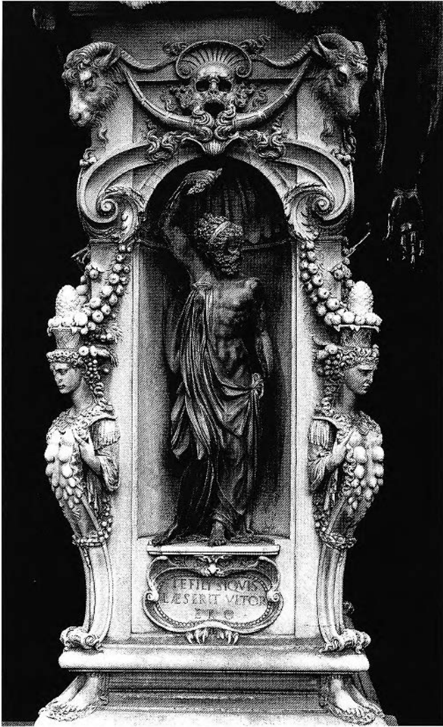
Figure 4. Benvenuto Cellini, Persée , 1545-54, piédestal de marbre, Florence, Loggia dei Lanzi (Photo : Alinari / Art Resource, NY).

cette Nature est souterraine, démoniaque ou surnaturelle, relevant de l'imagination. La « Nature » comprend toute la gamme de l'être, du sublimement céleste et du surnaturel au « sous-naturel » pour ainsi dire et au grotesque, en passant par l'humain, le quotidien et l'observable. La création aussi bien d'êtres surnaturels et supérieurs que d'êtres démoniaques et dénaturés reste le produit de l'imagination de l'artiste, qui se fonde néanmoins toujours sur l'étude de l'humain, de l'animal, et du végétal et ne leur donne une place que s'il peut les garder sous sa maîtrise et à son service.