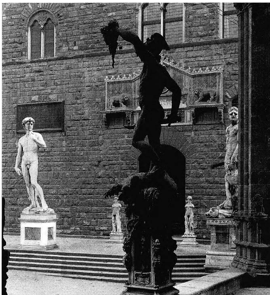
Figure 6. Vue du David de Michel-Ange, de l' Hercule et Cacus de Bandinelli, et du Persée de Cellini depuis la Loggia dei Lanzi de Florence (Photo : Réunion des Musées Nationaux / Art Resource, NY).

l'Art, œuvre masculine et en ronde bosse qui s'en libère et la domine de sa hauteur.