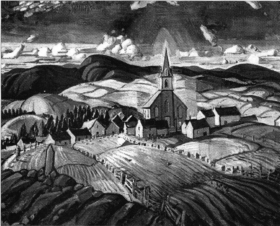
Figure 4. Arthur Lismer (1889-1965), Quebec Village, 1926, huile sur toile, 132 x 163 cm.

on a glowing August afternoon, had suddenly felt time stand still. The painting carried into it much of the essential religion and profound love of home which counter-balanced in the complex nature of its artist, his rebellious iconoclasm and his urbane universality of feeling. 36