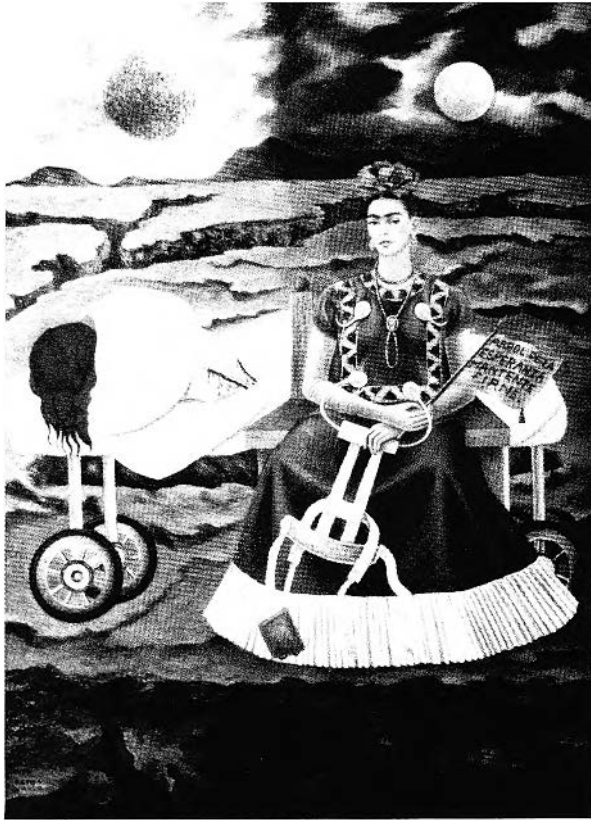
FIGURE 3. Frida Kahlo, Arbre de l'espérance, tiens bon , 1946. Coll. privée, New York.

les images sont très enracinées dans la réalité mexicaine; l'espace de ses tableaux (à la différence de ceux de Varo et de Carrington) est spécifiquement mexicain. Humour noir très dur, portant sur son vécu quotidien et douloureux (Fig. 3).