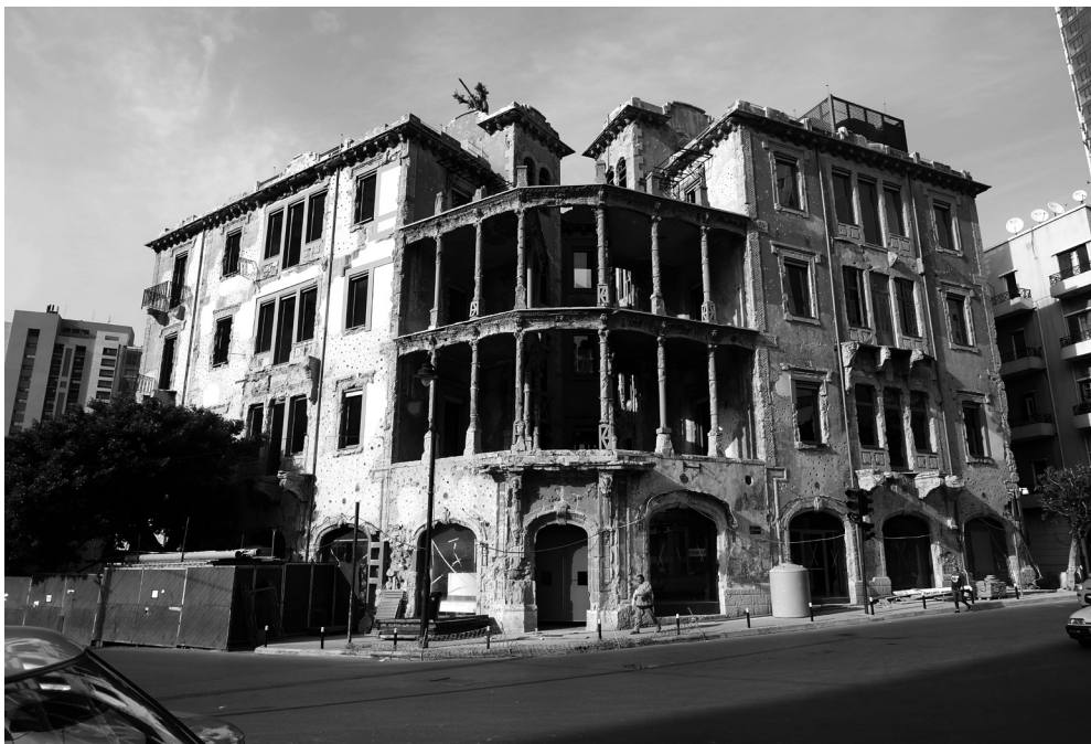
Beit Beyrouth: vue extérieure

t-il – constitue un écran, dissimulant l'intérieur de l'immeuble, à la grande satisfaction des combattants qui se l'approprient 23 ». Comme toute forme d'appropriation, cela ne va pas sans créer des modifications importantes à l'intérieur du bâtiment dans lequel, au premier étage, ont été trouvées des interventions majeures faites par les militaires, comme des barricades et un bunker, conçues afin d'exploiter « au mieux » la structure du bâtiment.