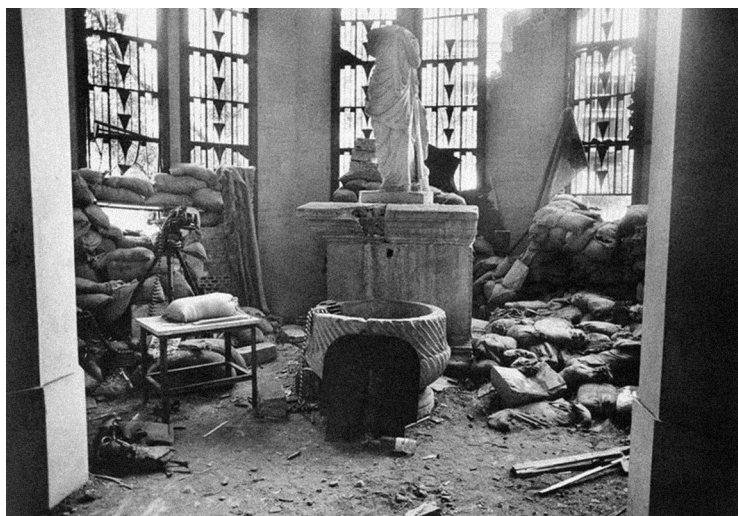
L'état du Musée national après le conflit (1990)