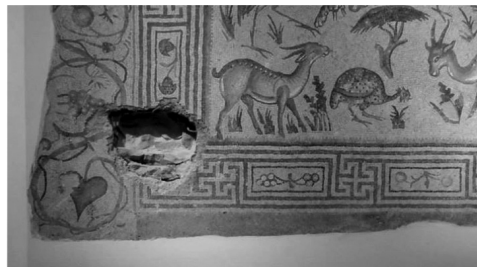
Découverte à Jnah, la mosaïque du Bon Pasteur (V ou VI siècle après J.C.) fait partie de la collection du Musée national de Beyrouth. Lors des travaux de restauration, les archéologues ont décidé de garder le trou du mortier qui remonte à l'époque du conflit.