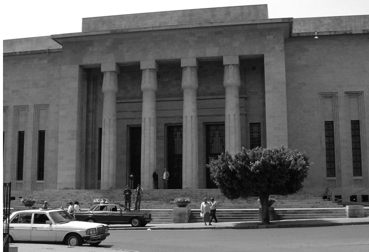
Le Musée national de Beyrouth