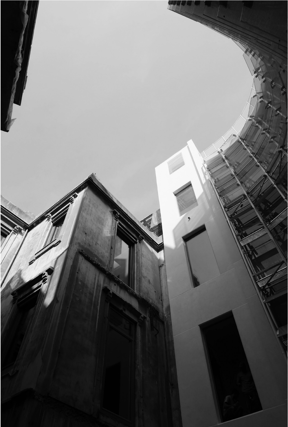
Beit Beyrouth: le bâtiment ancien et le moderne