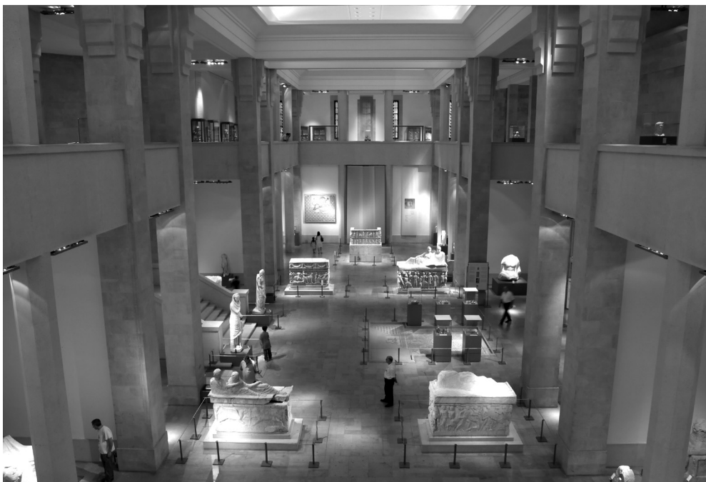
Vue de l'intérieur du musée national de Beyrouth