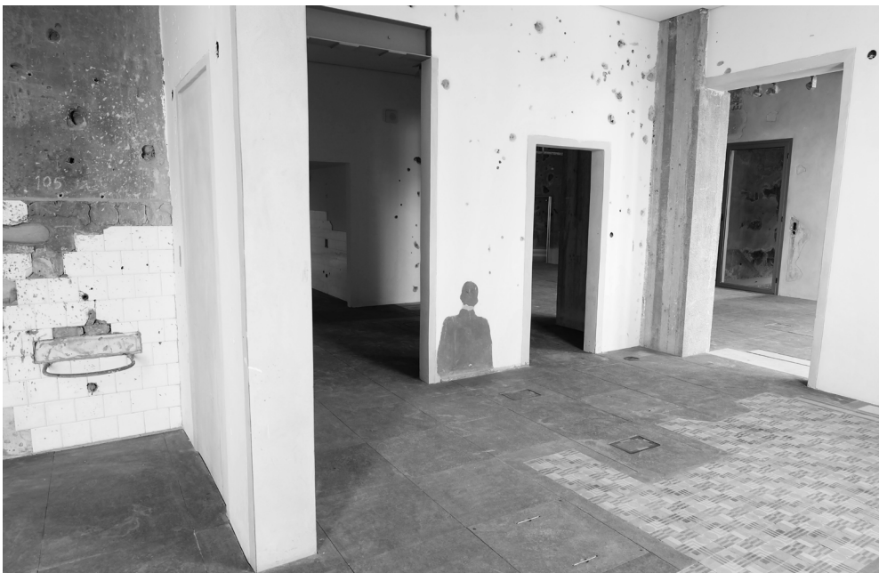
Beit Beyrouth: le 2 ème étage