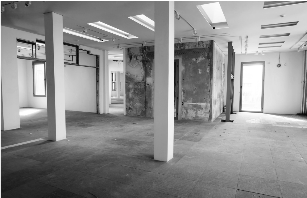
Beit Beyrouth: le 3 ème étage © Youssef Haidar