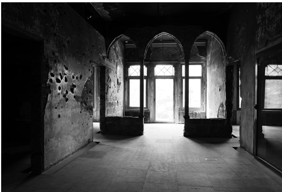
Beit Beyrouth: le 1 er étage © Youssef Haidar