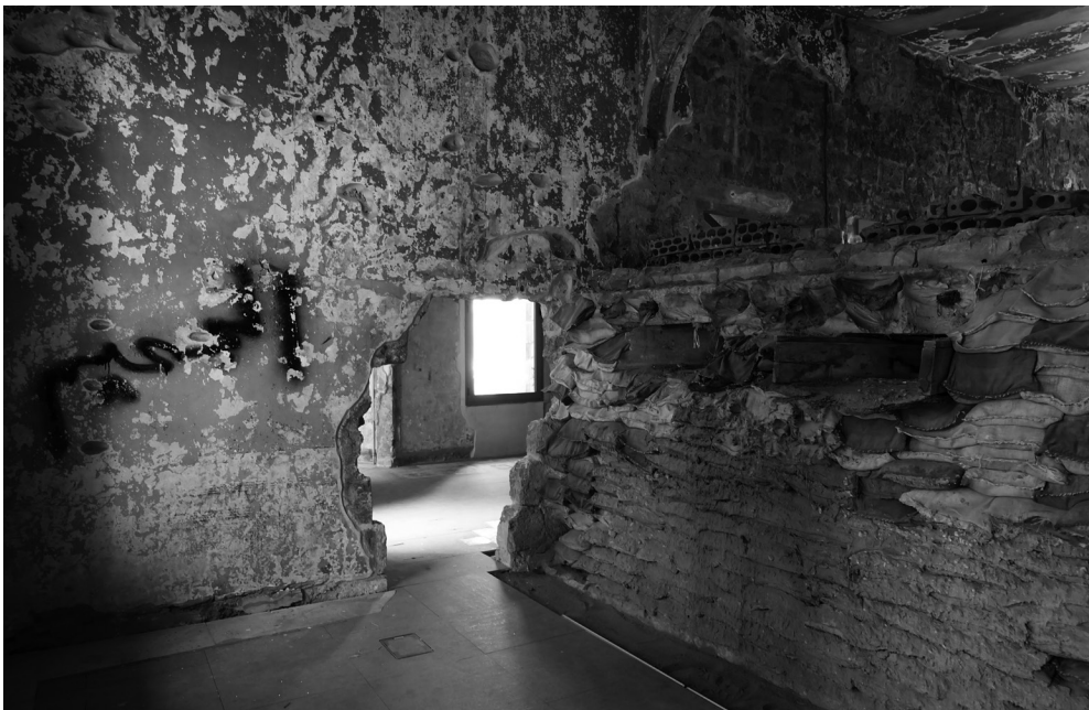
Beit Beyrouth: le bunker au 1 er étage