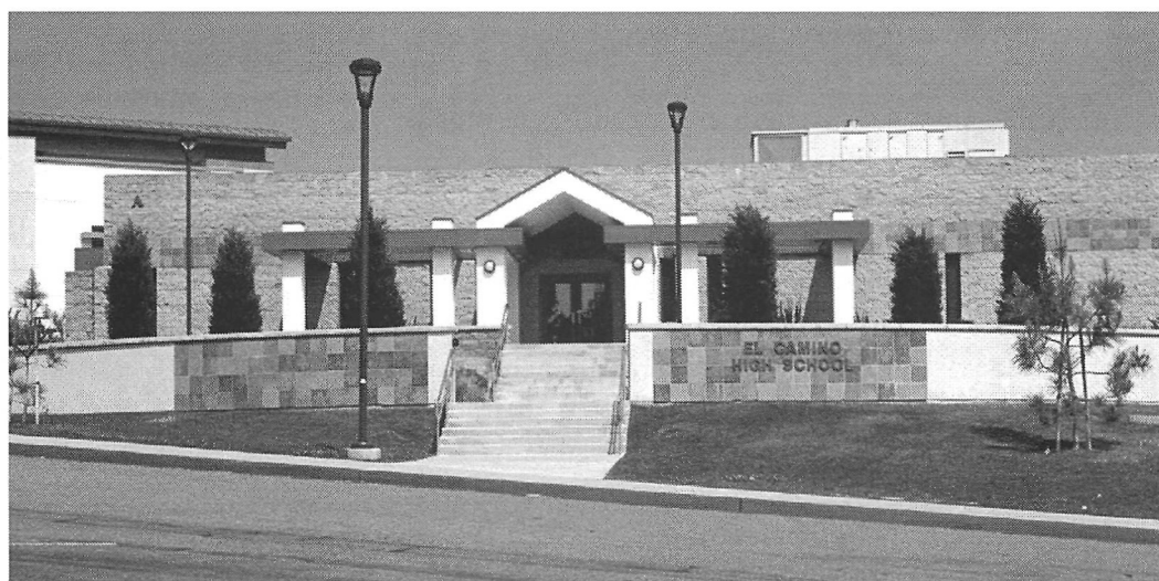
Vue des écoles ayant participé à l'étude : Martin Luther King Jr Middle School (image du haut) et El Camino High School (image du bas), Oceanside, CA.