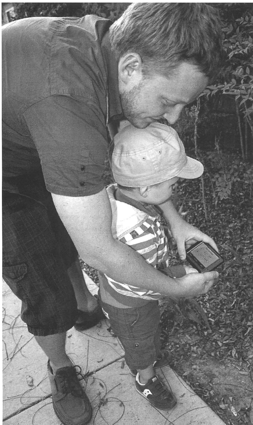
Vue de geocachers à l'œuvre Photo : Marie-Eve Champagne, 2011.