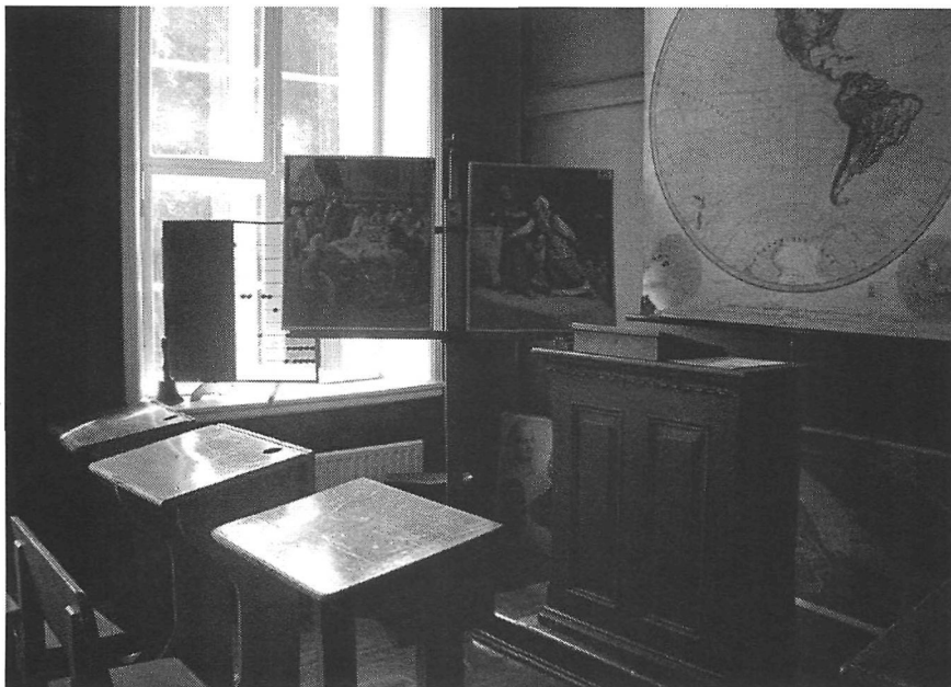
Reconstitution d'une salle de classe de l'école primaire (première moitié du XX e siècle) «Folkeskolens klasserom», Bergen Skolemuseum.