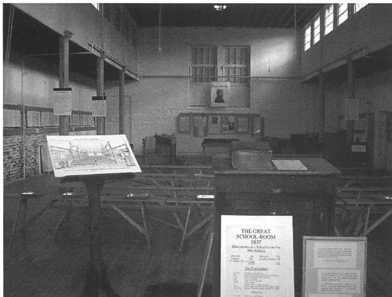
«The great Lancastrian Schoolroom» (1837) British Schools Museum Hitchin. Photographie : Myriam Boyer, 2007