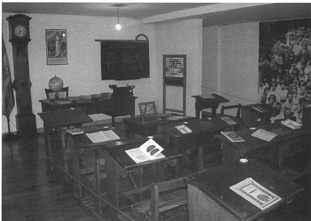
«Aula de Republica 1931-1936» Museo Pedagógico de Galicia.