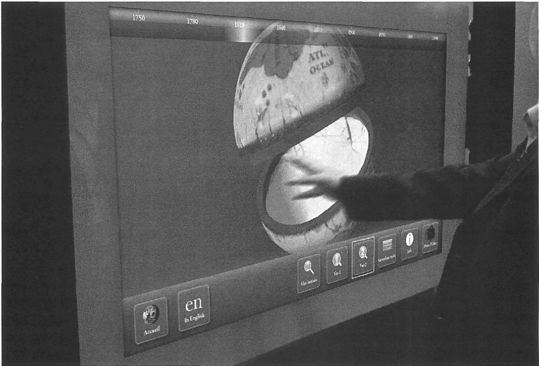
Borne 3D pour le Musée McCord, 2008