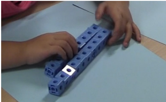
FIGURE 4. Image extraite de la vidéo de Claudine pour la tâche non contextualisée.

La stratégie mesure. Pour la tâche non contextualisée, trois élèves parmi 36 ont mis en place la stratégie que nous avons dénommée « mesure ». Par exemple, après avoir emboîté linéairement les cubes de chaque collection et les avoir mis côte à côte pour comparer leurs longueurs (Figure 4), Claudine a répondu à la première question en disant : « c'est pas pareil, celle-là est plus longue ».