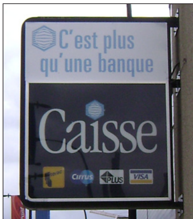
Photo 9 Enseigne faisant face à l'est