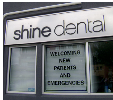
Photo 7 Enseigne unilingue anglaise

un certain nombre de touristes, aimeraient voir un message en anglais.