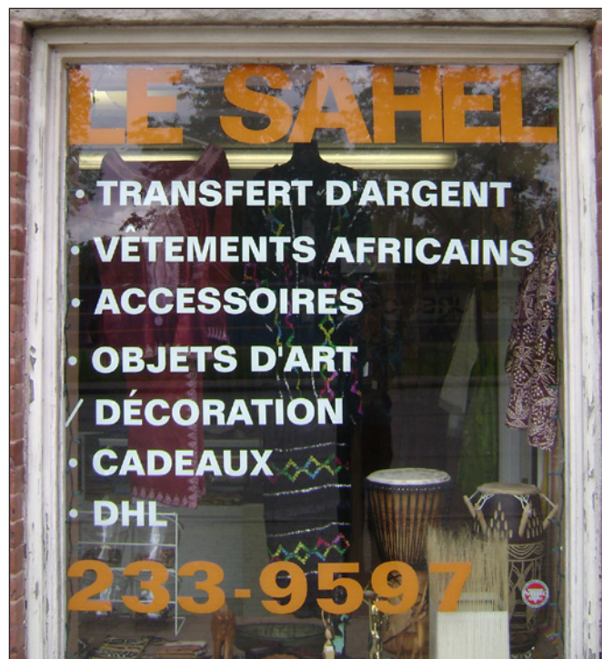
Photo 1 Le seul affichage commercial unilingue français