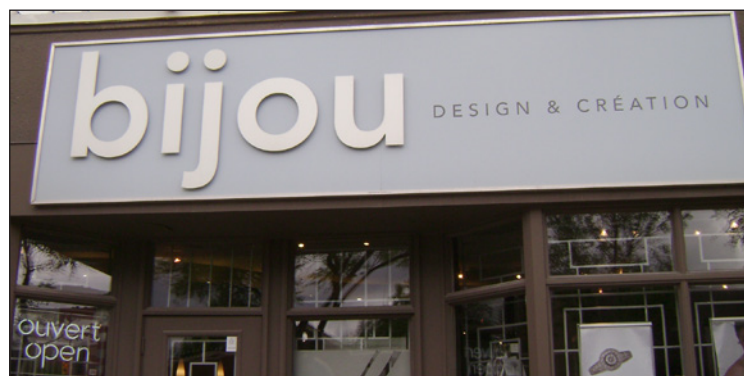
Photo 5 Enseigne bilingue du magasin Bijou

La majorité des panneaux de rues à Saint-Boniface, qui sont la responsabilité de la Ville de Winnipeg, sont bilingues et mettent le français devant l'anglais. Également, la majorité des noms de rues sont francophones, comme le montre le panneau à une intersection de l'avenue Taché (photo 6). La position du français s'explique surtout en raison de la grammaire. En français, on dit « avenue Taché » et en anglais, Tache Avenue . Mais il est important de noter que le nom « Taché » n'est pas écrit avec un accent, ce qui donne l'impression que le nom est écrit en anglais.