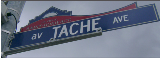
Photo 6 Panneau de l'avenue Taché

L'enseigne d'une clinique dentaire (photo 7) et le message que celle-ci affiche dans sa vitrine illustrent que le propriétaire ne croit pas que le français ait une valeur d'usage direct. Ainsi, il utilise la langue qui va transmettre le message. La clientèle visée est donc une clientèle anglophone ou qui parle assez bien l'anglais.