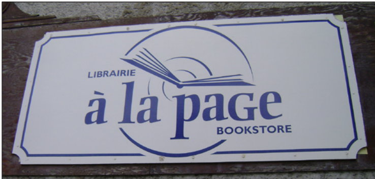
Photo 4 Enseigne de la librairie À la page