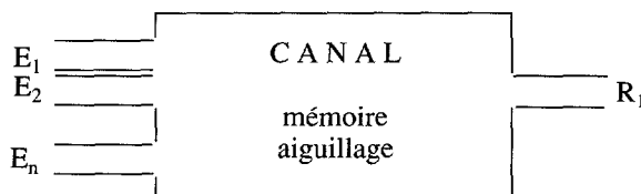
Fig. 1. Modélisation du système d'information.

Essayons de définir un modèle général des systèmes d'informations qui nous préoccupent (bibliothèque, centre de documentation, base de données bibliographiques, base de données textuelles). 7 Nous allons les considérer comme un canal complexe de communication (figure 1). Les messages en entrée sont émis par un grand nombre d'émetteurs. La communication entre certains d'entre eux et un utilisateur du système est réalisée grâce aux propriétés de mémorisation du canal et à l'aiguillage qu'il possède.