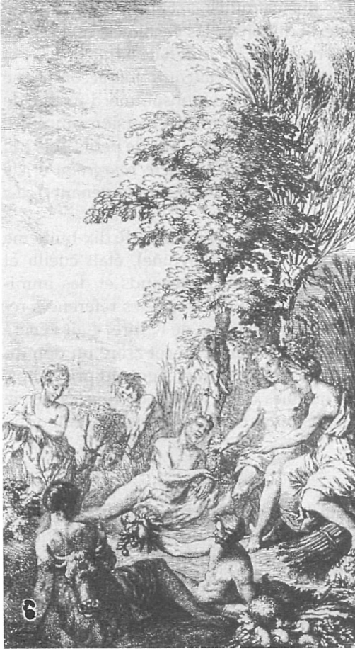
Figure 1 Les Dons de Comus. Frontispice.