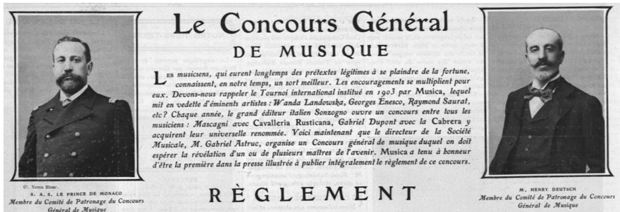
Figure 6. Deux membres du Comité de Patronage du Concours général de musique de la Société musicale de Gabriel Astruc (July 1905). À gauche, le Prince Albert de Monaco, et à droite, Henry Deutsch de la Meurthe.