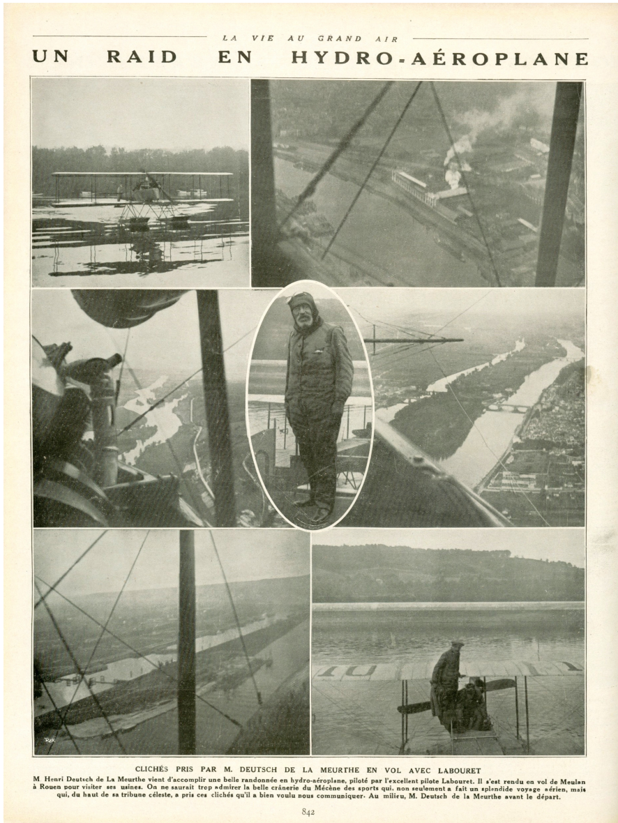
Figure 4. Photoreportage sur le «raid en hydro-aéroplane» que Deutsch de la Meurthe, l'auteur des clichés, a effectué avec le pilote René Labouret ([Anonyme] 1912b), Bibliothèque nationale de France, https://gallica.bnf.fr/ark:/12148/bpt6k9605318j/f11.item