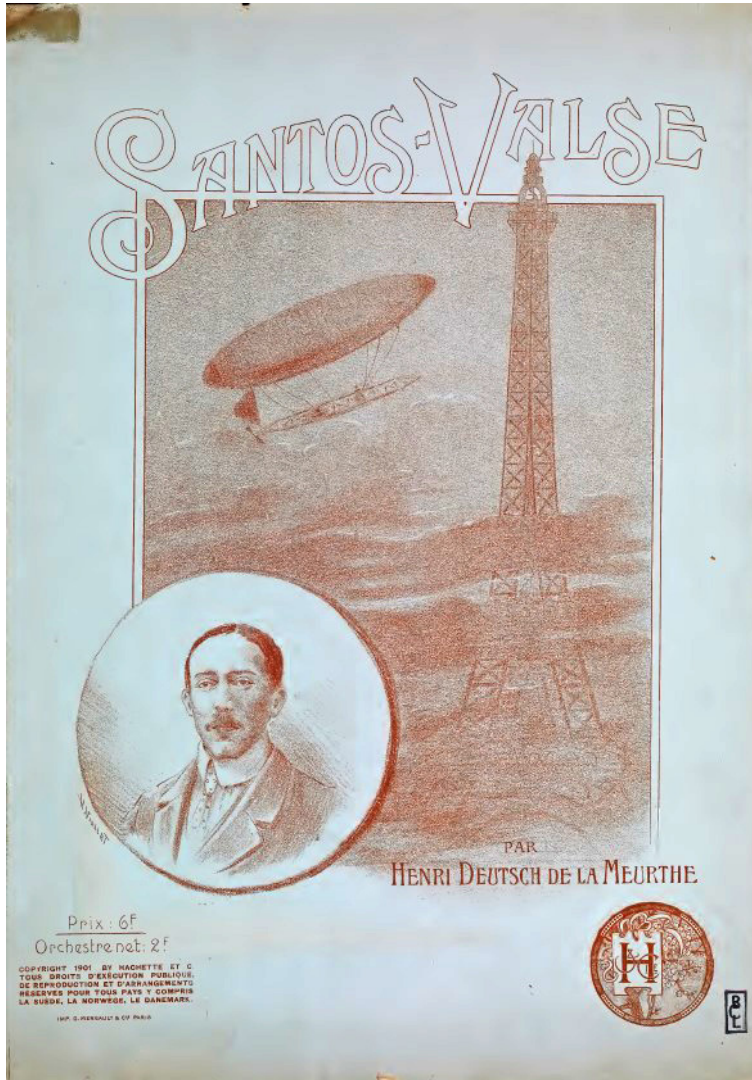
Figure 1. Couverture de Santos-valse d'Henry Deutsch de la Meurthe (Hachette, 1901), Smithsonian Libraries, https://library.si.edu/digital-library/book/santosvalseoodeut

que le refrain commente chaque fois « mais ça n'fait rien, | Tout va très bien ! | Dans huit jours ell' s'ra remplacée, | Et nous pourrons, sans nous lasser, | L'expérience recommencer ! ».