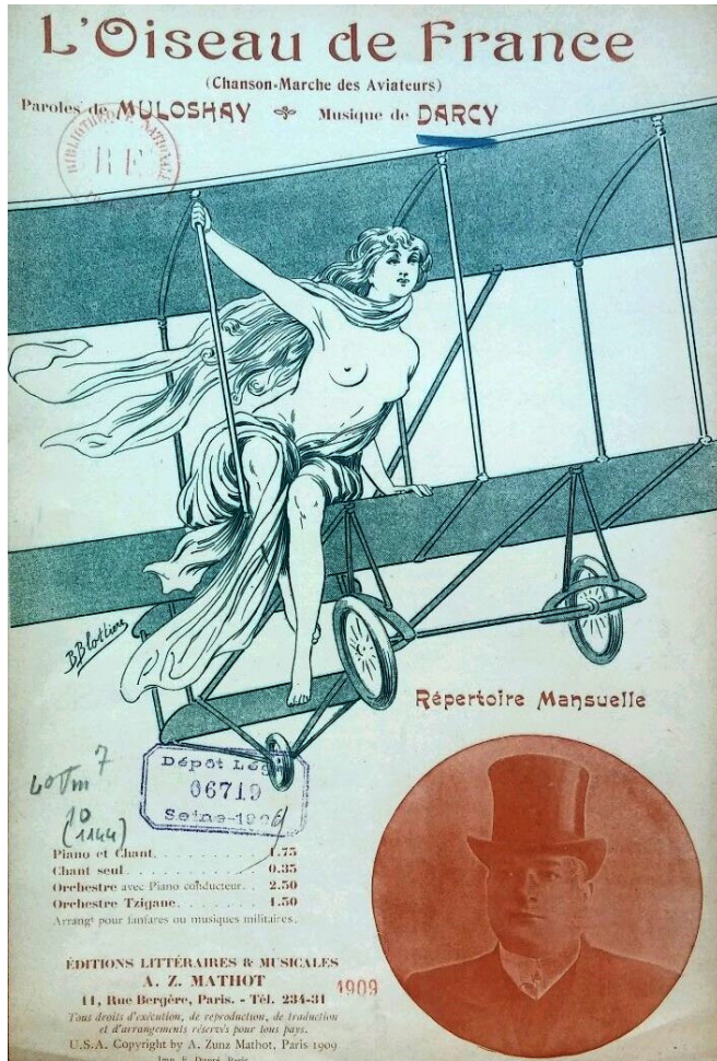
Figure 3. Couverture de B. Blottière pour L'Oiseau de France: chanson-marche des aviateurs , paroles de Mulhausay et musique de Gabriel Darcy [Émile Vuillermoz] (A. Z. Mathot, 1909), Bibliothèque nationale de France.

(musique) où la narratrice chante: « À côté d'lui dans la nacelle | J'ai pris le levier a plein' main | Lui s'occupait d'la manivelle | Plus je serrais | Plus ça montait | Je jouissais... du paysage | Ah! Que c'est beau! | En aéro | À deux de faire un p'tit voyage » 19 . Ces chansons grivoises, qui vont pour certaines jusqu'à nommer des aviateurs 20 , montrent bien à quel point l'aviation et ses héros ont pénétré la culture populaire à partir de 1909.