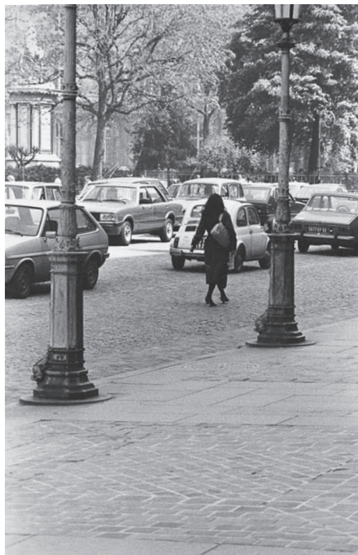
Fig. 6. Rapport du détective (à partir de 17 h 10). Sophie Calle, « La filature », dans À suivre... , Doubles-jeux (livre IV) , Actes Sud, 1998. © Sophie Calle/SODRAC 2006. © Actes Sud 1998.