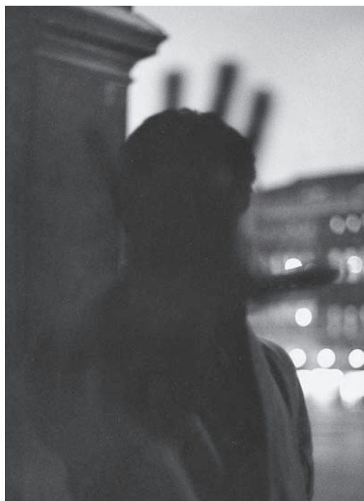
Fig. 3. Sophie Calle, « Suite vénitienne », dans À suivre... , Doubles-jeux (livre IV) , Actes Sud, 1998. © Sophie Calle/SODRAC 2006. © Actes Sud 1998.