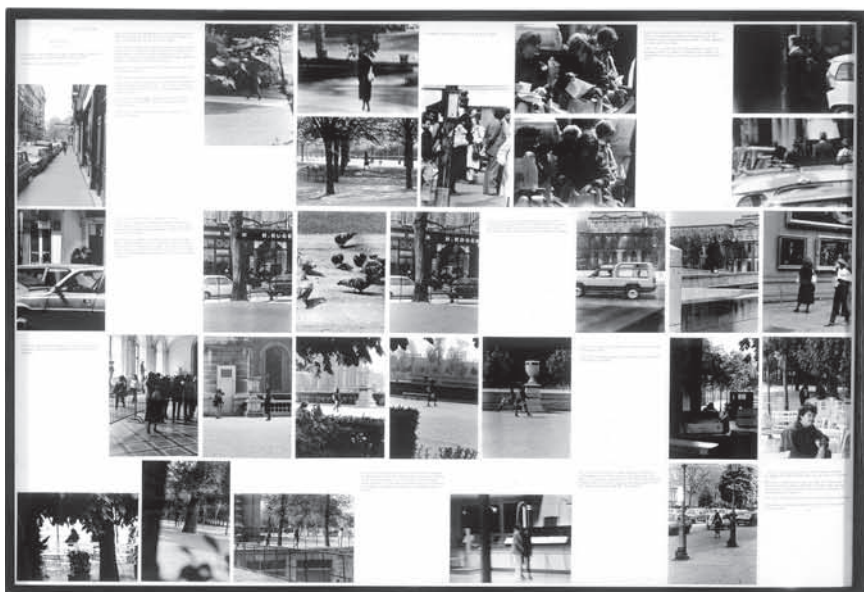
Fig. 1. Sophie Calle, La filature, vue d'installation, Galerie Emmanuel Perrotin, Paris, 1981-2001.