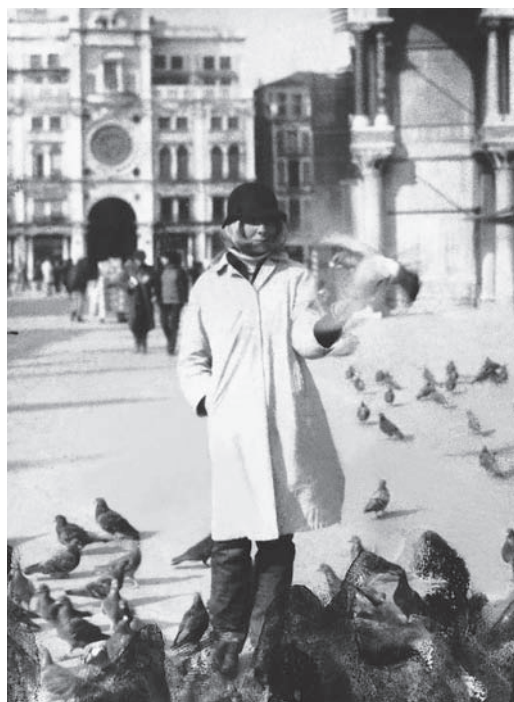
Fig. 4. Sophie Calle, « Suite vénitienne », dans À suivre... , Doubles-jeux (livre IV) , Actes Sud, 1998. © Sophie Calle/SODRAC 2006. © Actes Sud 1998.