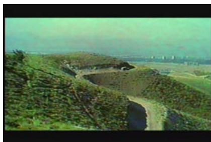
© Abbas Kiarostami, Le goût de la cerise , Copyright Marin Karmitz/Abbas Kiarostami, 1997 (photogrammes extraits du film).

On songe à Kierkegaard qui, à la fin de son volumineux ouvrage Les miettes philosophiques , promet une suite. Ce sera Post-scriptum aux Miettes philosophiques , ouvrage encore plus volumineux que le précédent. Il écrit :