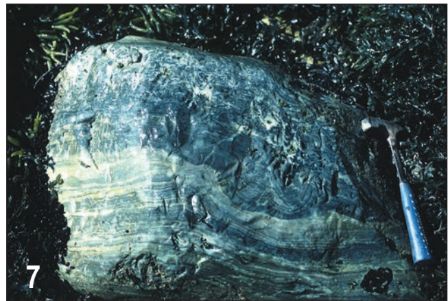
FIGURE 4. Bloc de dolomie cristalline rose de type marbré (22 x 19 x 17 cm ; 23 kg), sur substrat argileux, sur la rive nord du havre du Colombier (13.8.99).

A pink dolostone erratic, marble-like type (22 x 19 x 17 cm, 23 kg), on a clayey substrate, north shore of Havre du Colombier (99.8.13).