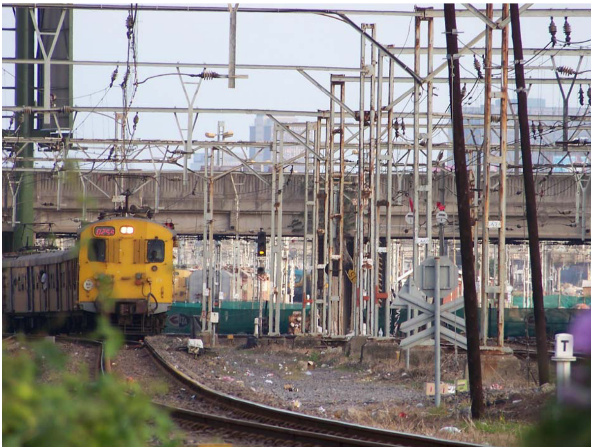
Auteur : Stéphane Vermeulin