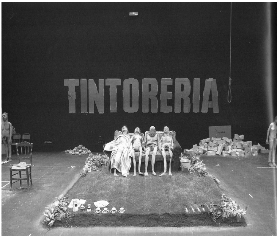
Photographies : Alberto Nevado. http://www.albertonevado.com/