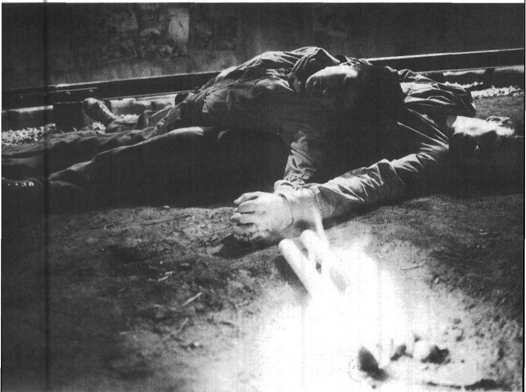
Le Rail de Gilles Maheu, Carbone 14.