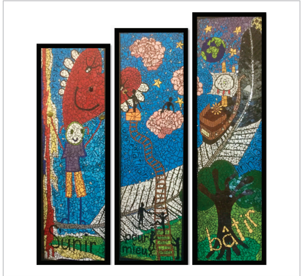
Figure 1. Fresque S'unir pour mieux bâtir (École des Quatre-Vents et Mosaïque Sociale, 2018)

Cette fresque (figure 1), par exemple, a été réalisée en 2018 par les élèves de toute l'école avec la collaboration de Mosaïque Sociale, un organisme à but non lucratif de Roberval ayant comme mission de rassembler la population par les arts en favorisant entre autres l'éducation, la solidarité, l'entraide ainsi que les échanges interculturels et intergénérationnels.