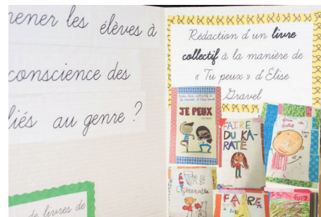
Figure 2. Les dessins des élèves qui représentent des inversions des rôles de genre

Ces activités de lecture, de réflexion et de dessin semblent avoir permis à l'enseignante de créer un espace sécurisant en salle de classe à travers lequel ses élèves de 1 re année pouvaient explorer le sens culturel rattaché au genre. Soulignons que ce genre de pratique pédagogique fait auprès d'enfants d'environ 6 ans est encore très rare dans les écoles ontariennes, incluant les écoles de langue française.