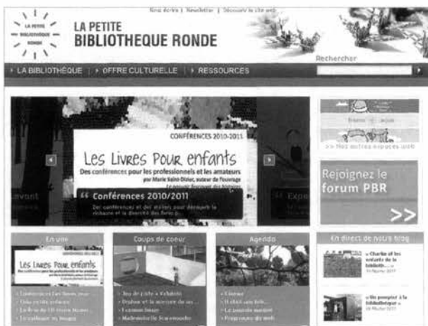
Le site Internet de la Petite Bibliothèque Ronde : <www.lapetitebibliothequeronde.com>

systématiquement dans le top 3 chez les 4-17 ans tandis que la part occupée par la télévision et par l'informatique va augmenter avec l'âge des enfants. La lecture, en seconde position chez les 4-9 ans, n'est plus qu'en huitième position chez les plus grands : 70 % des enfants déclarent aimer lire, mais 50 % évoquent l'obligation par l'école ou lire en situation d'ennui.