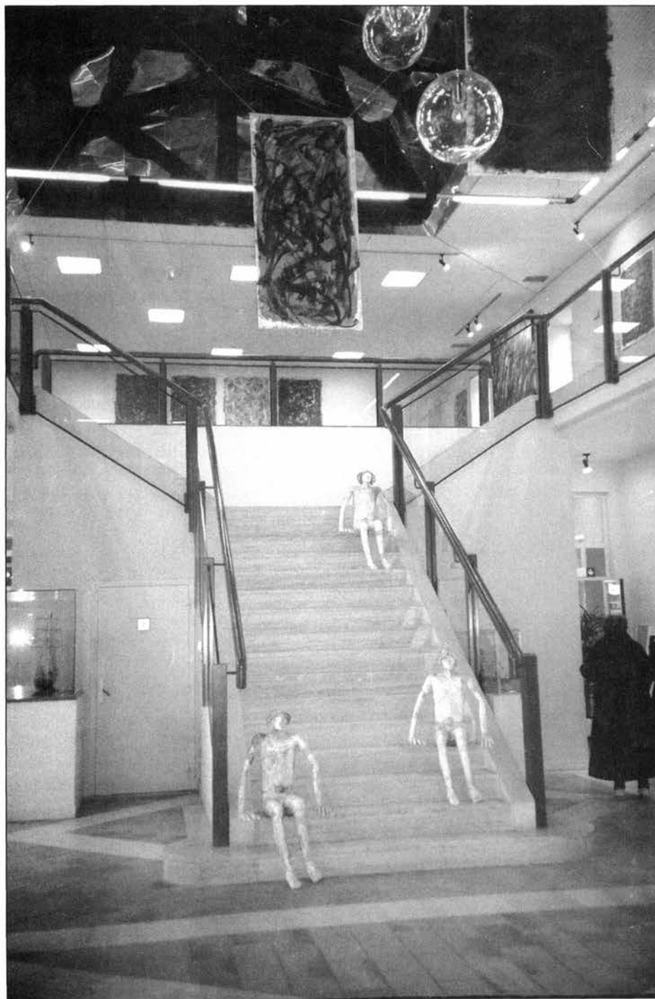
La Bibliothèque-Médiathèque de Rochefort