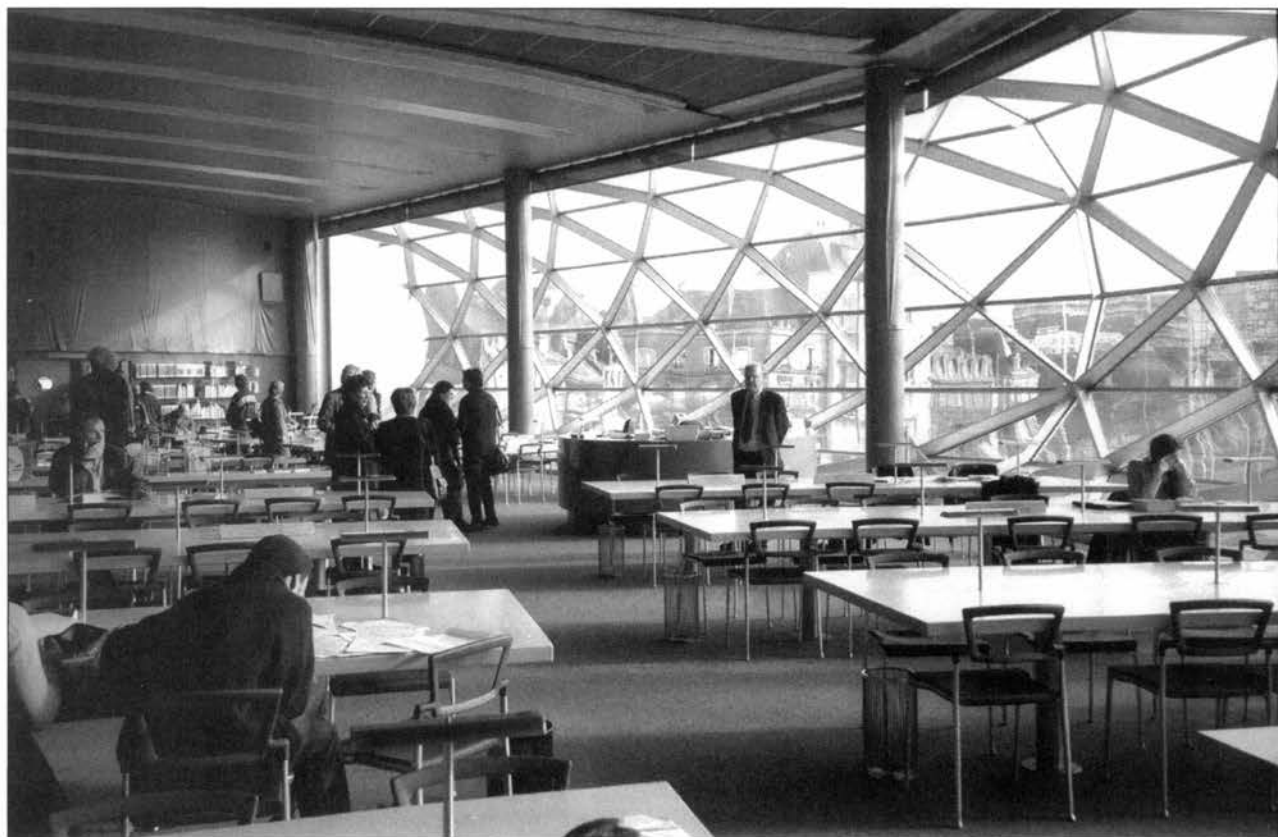
La Médiathèque d'Orléans

Les sections jeunesse sont toutes personnalisées et originales. À Rochefort, une chaloupe échouée permet de s'asseoir et de lire, des étagères sont logées sous une marquise. Des éléments archéologiques décorent la bibliothèque de Poitiers. Celle d'Orléans exhibe des couleurs intenses et contrastées comme le «bleu piscine» du sol plastifié et brillant, entrecoupé de trois moquettes aux motifs représentant divers éléments du cosmos. Pour la salle réservée à l'heure du conte, une vaste rotonde refermée sur elle-même à La Rochelle et à Limoges, une pièce octogonale avec vitrine de verre en saillie à Orléans.