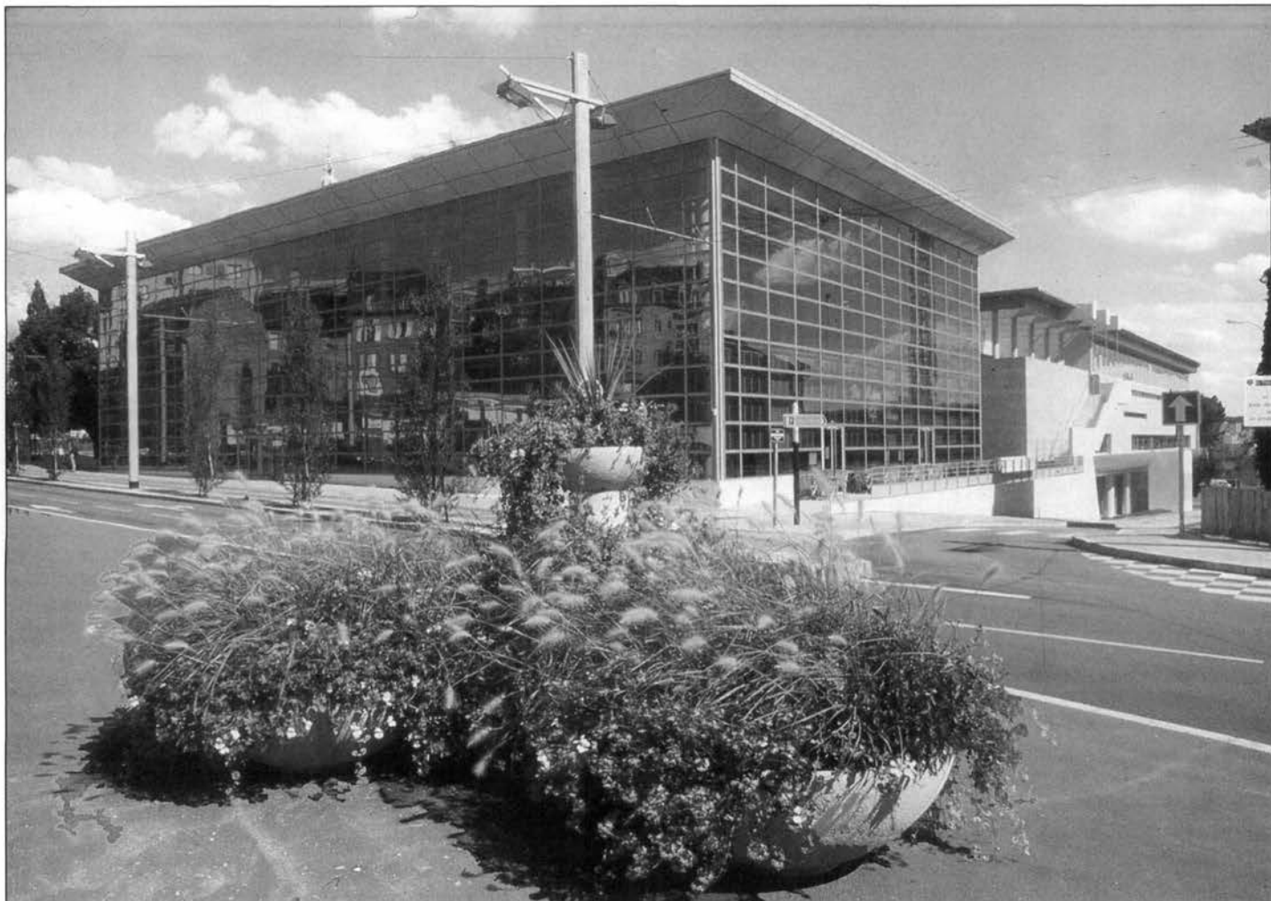
La Bibliothèque francophone multimédia de Limoges