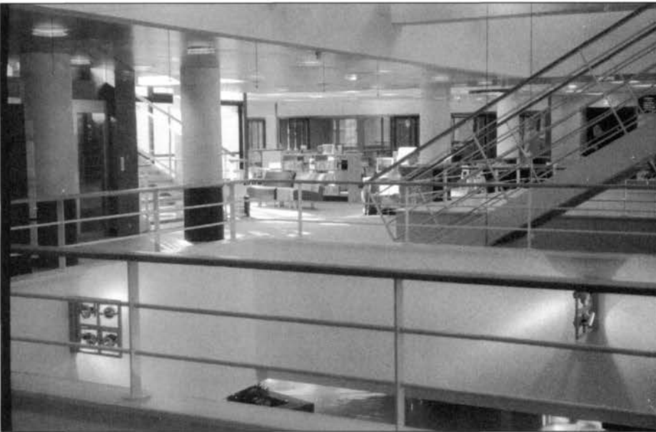
La Médiathèque Michel-Crépeau de la Communauté d'agglomération de La Rochelle

ces lieux ont une complexité semblable à celle des hypertextes, ils sont cependant conçus comme un volume unique qui fédère les parties.