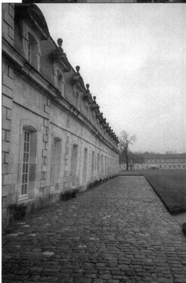
La Bibliothèque-Médiathèque de Rochefort

La toute petite ville portuaire de Rochefort décide de redonner vie à de très anciens bâtiments complètement ravagés après la Deuxième Guerre mondiale, longtemps abandonnés et faisant partie d'un secteur jugé plutôt mal famé par la population locale. En plus d'un musée, de divers organismes, d'un petit resto et d'une boutique de souvenirs, elle y installe la bibliothèque dans la partie centrale de la Corderie Royale mise en chantier en 1666 sous l'ordre de Louis XIV. Cette ancienne manufacture de cordages de bateaux a été le plus long bâtiment industriel de l'Europe au XVII e siècle (373 mètres).