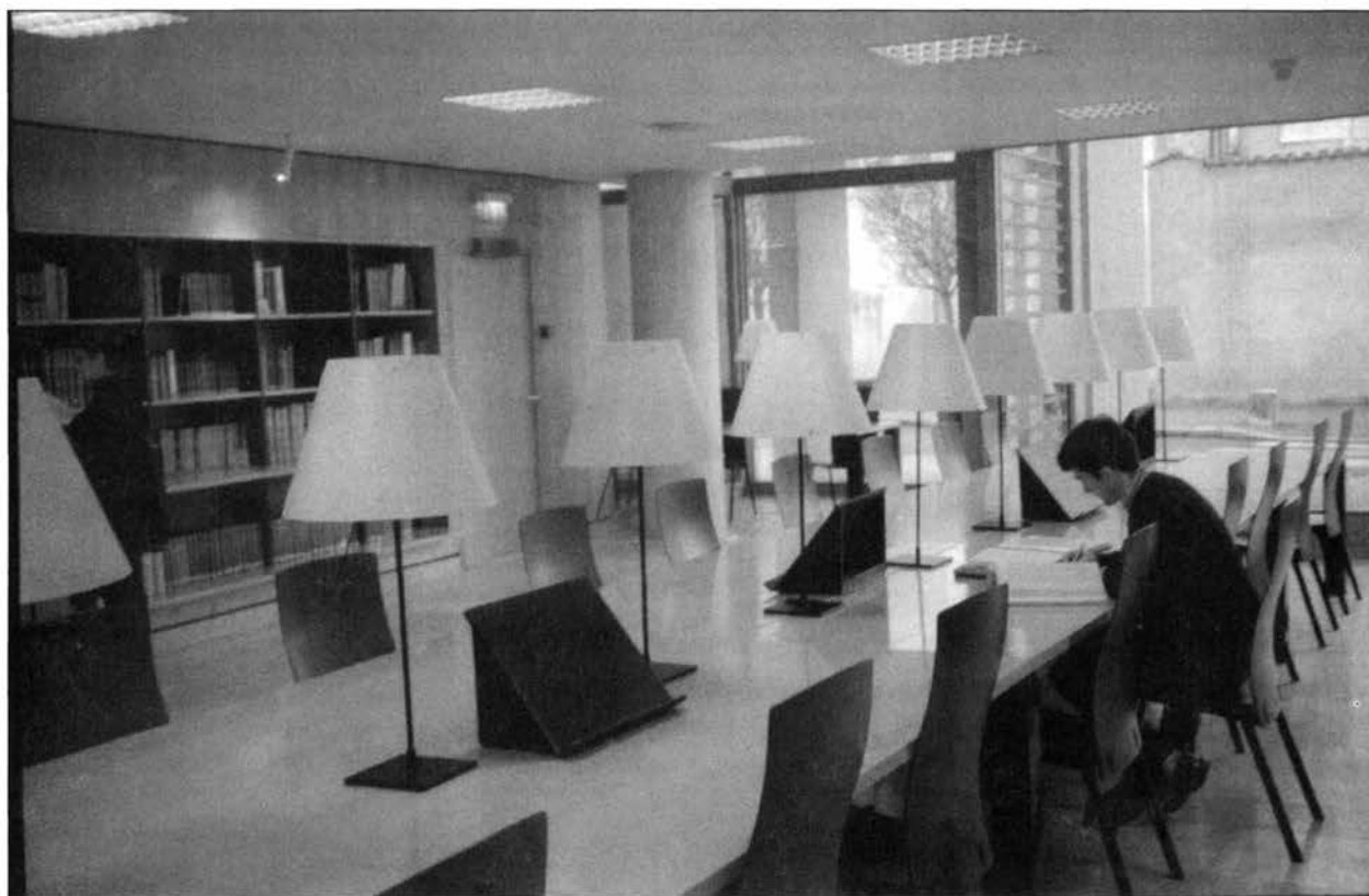
La Médiathèque François-Mitterrand de Poitiers

rel autour du livre et de la lecture. L'année durant, ces bibliothèques proposent à tous les publics : expositions, conférences, lectures-débats, colloques, heures du conte, projections de films, concerts, manifestations diverses comme des ateliers d'écriture, rencontres avec des auteurs et des illustrateurs, et initiations aux nouvelles technologies. Limoges organise depuis quinze ans la Fête du livre, avec un accent sur le livre jeunesse. L'événement a attiré 60 000 visiteurs en avril 1998 sous un chapiteau de 2 300 m 2 érigé sur une grande place publique où étaient regroupés plus de 200 auteurs. Poitiers accueille des écrivains en résidence, accorde un prix du roman historique et tient, en novembre, une manifestation annuelle « Écrivains présents » autour d'une vingtaine d'écrivains. Cette action culturelle, comme on l'écrit à Limoges, « apparaît comme un outil essentiel pour conduire de nouveaux publics vers une pratique culturelle ». Par cet éventail d'activités, elles participent toutes de manière permanente et forte à la vie de la cité.