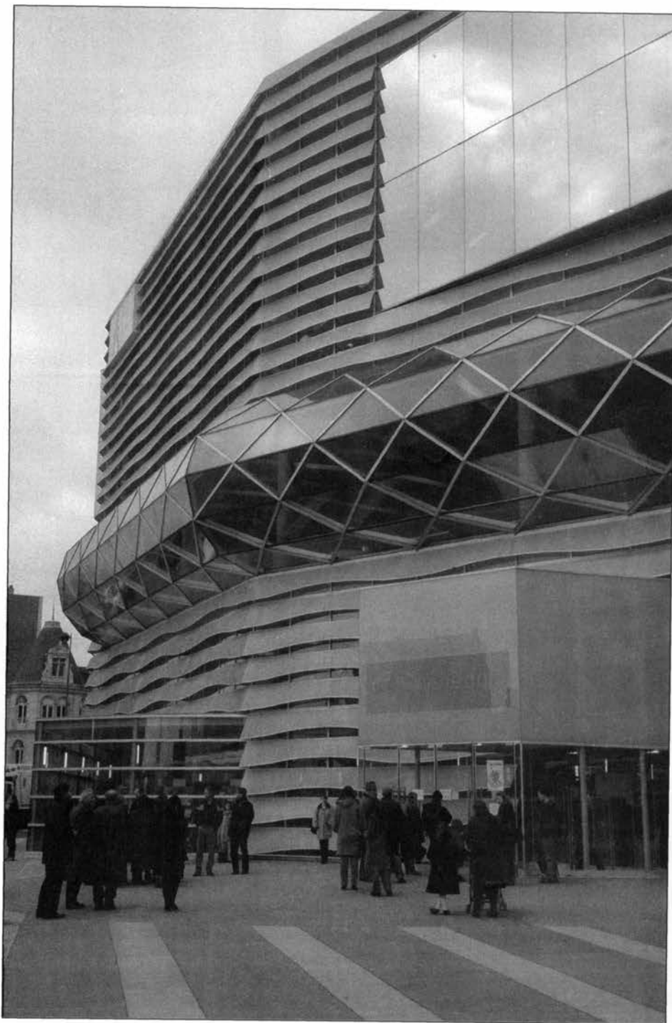
La Médiathèque d'Orléans

sous-sol. Dans cette première ville d'importance du Centre-Ouest, la bibliothèque est implantée en face de l'hôtel de ville du XIX e siècle et constitue la pierre angulaire d'une vaste opération d'urbanisme destinée à régénérer et à revitaliser un quartier historique qui inclura des équipements administratifs, culturels et universitaires.