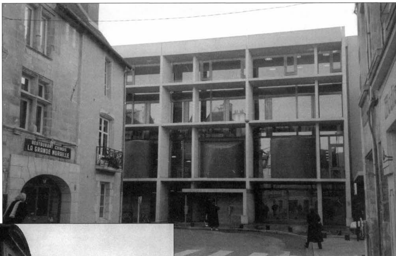
La Médiathèque François-Mitterrand de Poitiers