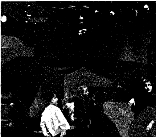
En attendant l'heure du conte . . . Bibliothèque Richview (Etobicoke)