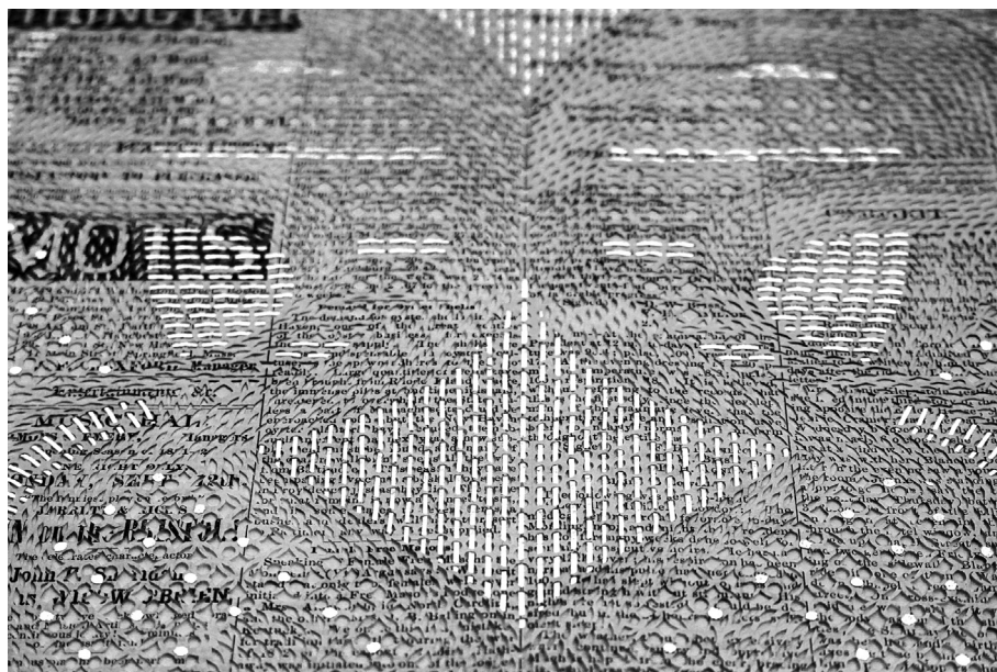
Myriam Dion, Train Robbery, Jesse James, The Morning Mail, September 10, 1881 (détail), 2018. Papier journal coupé au couteau x-acto, collage de papier japonais et feuille d'or, 44,5 × 60 cm.